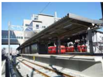
2・3番線(仮線・仮ホーム)