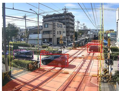
AI画像解析装置により物体を検知している様子(イメージ)