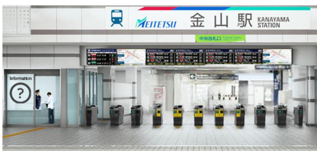
金山駅中央改札口付近（イメージ図）