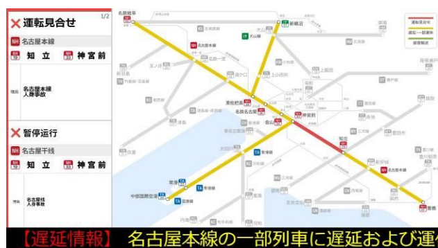
エムビジョン（イメージ）