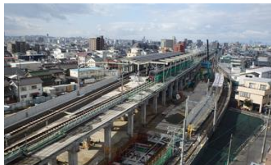
喜多山駅付近の高架化工事