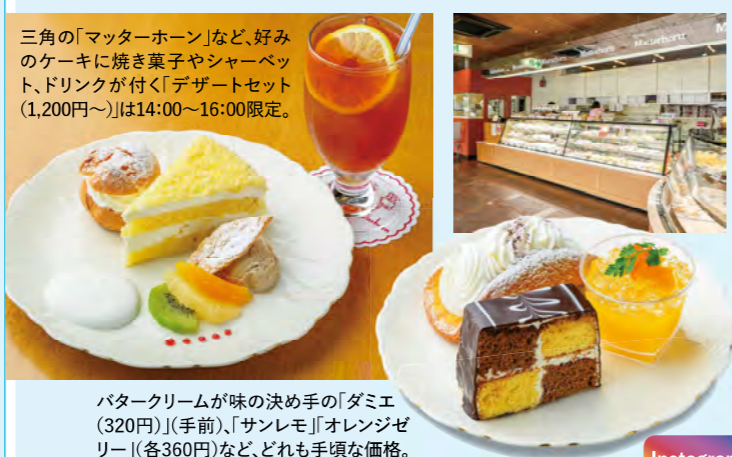
バタークリームが味の決め手の「ダミアエ(320円)」(手前)、「サンレモ」オレンジゼリー(各360円)など、どれも手頃な価格。

東京にある「マッターホーン」から暖簾分けし、豊橋で50年以上も愛される洋菓子店。レトロモダンな雰囲気。店内には、店名を冠したケーキ「マッターホーン(360円)」をはじめ、昔ながらのレシピを大切に守る洋菓子が並びます。地元産フルーツを使ったスイーツも多く、「缶クッキー」も人気。常連客でにぎわうカフェスペースでは、開店から1時まで、ドリンクの注文で日替わりケーキが無料でサービスされます。