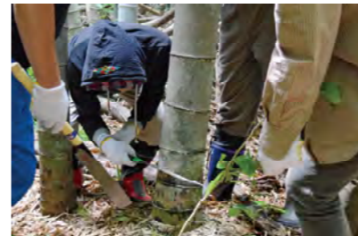
節周りの白さや産毛などで、生育から3年以上経過した竹を見極め、まっすぐに肉厚なものを選ぶ。

花火の最後に筒の底から地面に向けて噴出する「ハネ」は、火の粉が一気に噴き出した状態。手筒が上にグンと跳ねるほどの勢いだ。筒内に火の粉が残って竹筒が燃えることを防ぐ仕組みで作られている。