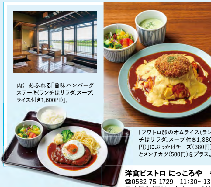
肉汁あふれる「旨味ハンバーグステーキ(ランチはサラダ、スープ、ライス付き1,600円)」。

吉田神社の裏にひっそりとたたずむ、隠れ家のような洋食店。大手外食チェーンで商品開発や店舗の立ち上げに携わっていた店主が腕を振るい、オムライスやハンバーグ、有頭エビフライといった王道メニューを中心にラインアップ。料理の原点は「母の得意料理」に「ころがし」にあり、その想いは店名にも込められています。店の裏には豊川（とよがわ）が流れ、赤く染まった夕景が魅力的な絶好のロケーションです。