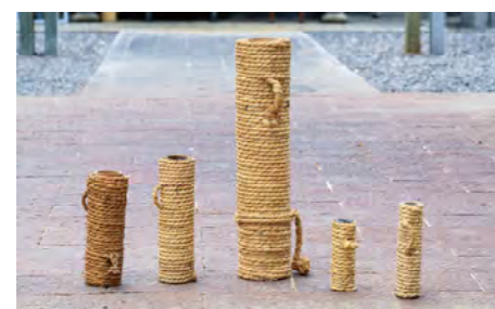
「手筒花火」の重さは約10kg、長さ80~90cm。片手で揚げる小ぶりの「ヨーカン花火」も「手筒花火」の一種だ。

現在、豊橋市内では60を超える地域で「手筒花火」が放揚され、なかでも毎年7月に行われる吉田神社の祭礼、通称「豊橋祇園祭」は、夏の風物詩として知られている。祭りは3日間行われ、「手筒花火」を奉納する「宵祭」で幕を開けると、「前夜祭」では、打ち上げ花火が豊川河川敷の夜空を彩る。最終日には、氏子やみこしがまちなかを厳かに練り歩いて幕を閉じる。