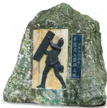
吉田神社の境内に建つ「手筒花火発祥之地記念碑」には、手筒花火の歴史が刻まれている。

巨大な火柱が勢よく夜空へと噴き上がり、最後にズドンと耳をつんざく音が境内に鳴り響く。東三河地域を中心に広まる「手筒花火」は、火薬を詰めた竹筒を人が抱えて放揚する伝統的な神事だ。一般的な打ち上げ花火のように、夜空に大輪の花を咲かせるのではなく、揚げ手が火の粉を全身に浴びながら、微動だにせず構え立つ。その姿は実に勇壮で、「静」と「動」の対比が見どころのひとつだ。