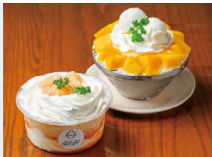
「ももピンスソフト(1,180円)」とアイス付きの「マンゴーピンスソフト イートイン Ver.(1,380円)」。

韓国風ミルクかき氷「ピンス」が夏の看板メニュー。地元で仕入れる牛乳とシロップを瞬間冷凍して作る氷はフワフワで、口の中でスッと溶ける食感が魅力です。氷の上にはたっぷりのカットフルーツとムース状にしたクリーム、中には自家製フルーツソースが入り、最後まで食べ飽きない美味しさ。大通り沿いのテラス席と、隣接する建物2階も利用でき、目の前を走る路面電車が眺められます。