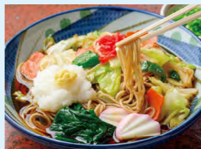
野菜を炒めてのせた「野菜炒めおろし(900円)」。甘めの冷つゆと大根おろしが好相性です。

勢川本店 豊橋市松葉町3-88 ☎0532-54-0614 11:00~19:30 月曜休(7/20は営業)、第3月曜の翌火曜休