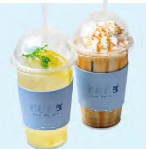
自家製はちみつレモン入りの「レモネード(500円)」、エスプレッソで作る「キャラメルラテアイス(540円)」。