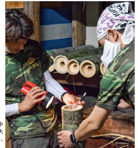
噴出口の「鏡」を付けることで、筒の中の火薬の圧力が高まり、勢いのある火柱となる。酒井さんの上伝馬町では、「鏡」に檜(ひのき)を使用。

4月になると、早くも「豊橋祇園祭」に向けての活動がスタートする。市や県の公的予算には頼らずに、企業や個人から協賛を募り、寄付集めにも奔走。官公庁へのあいさつ回り、近隣住民への説明など、役割を分担して作業を進めていく。 梅雨入りする6月上旬、八カ町が一堂に集まり煙火講習が行われると、参加者の氏はここから本番モードに。まずは、竹林に向い筒の材料となる孟宗竹を採取。「若い竹は水分量が多く、乾くと縮んで割れやすくなり、放揚する際に破裂する危険があり