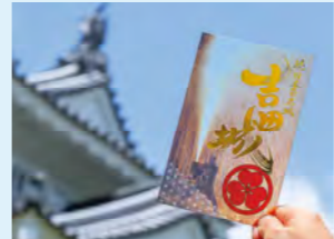
透明素材が珍しい、「特別版手筒花火酒井忠次の家紋入り御城印(1,000円)」。頒布は、豊橋市役所東館1階13号うひろば、13階展望レストランにて。

明応5年(1496年)頃、牧野古白によって築かれた今橋城が前身で、松平(徳川)家康の重臣・酒井忠次らが城主を務めた東三河の要塞です。現在の豊橋公園一帯が城址とされ、模擬復興した鉄櫓(くろがねやぐら)内では、古絵図や本丸周辺の模型などが公開されています。見どころは、池田輝政(照政)時代に整備されたという現存する石垣。のちの姫路城築城へとつながる技術の一端が感じられます。