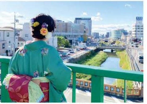
着物のレンタルは事前予約制。お雛めぐり期間中に、着物で「瀬戸蔵」に来館した人には和菓子の引換券をプレゼント。