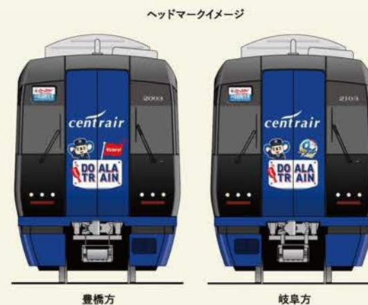
ヘッドマークイメージ

名古屋鉄道は、オフィシャル・パートナーであるプロ野球球団・中日ドラゴンズとコラボしたラッピング電車「DOALA TRAIN(ドアラトレイン)」を運行中です。通常のミュースカイの配色を反転させたブルーミュースカイに、名鉄の制服を着用した「名鉄駅員ドアラ」や、「中日ドラゴンズ90周年記念ロゴ」をデザインした特別な仕様となっています。この電車とともに、新たなシーズン開幕に向けて始動する中日ドラゴンズを地域一丸となって応援しましょう！