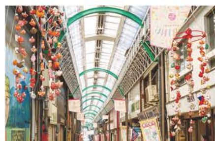
つるし飾りが揺れる「せと末広町商店街」。昨年度のイベント期間中は、まち全体で93,000人の来場者数を記録。

4mにもなる11段のピラミッド型ひな壇にずらりと並べられる。瀬戸とともに「日本六古窯」に数えられる、常滑や信楽、越前など、全国各地のやきもの産地から集められた作品も含め、陶磁器やガラスで作られた約800体の創作雛人形が勢揃いする様子は圧巻だ。ほかにも、商店のショーウィンドーやまちなかの施設に雛人形が飾られたり、布や紙製のつるし飾りが商店街のアーケードを彩ったりと、イベント期間中は瀬戸のまちが雛祭りのムードでいっぱいになる。