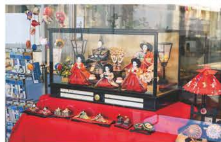
商店のショーウィンドーには、各家庭の雛人形が飾られている。なかには、豪華な御殿飾りのお雛さまも。