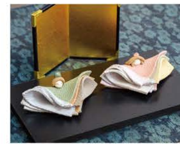
板状の粘土を重ねて折り畳んだ、小さな雛人形も。「新世紀工芸館」で展示・販売。