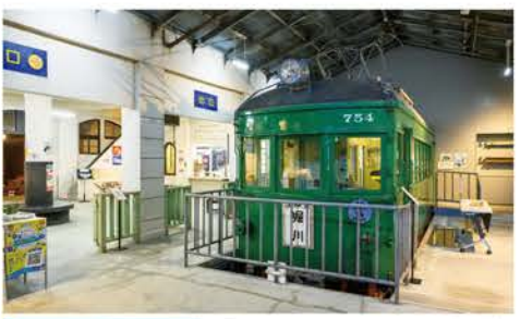
「ひなミッド」が設置される瀬戸観光の拠点施設。館内の「瀬戸蔵ミュージアム」には昔の瀬戸のまち並みが再現され、瀬戸焼の歴史に触れることができる。

「ひなミッド」以外にも、「陶のまち瀬戸のお雛めぐり」の見どころは満載。「瀬戸蔵」をはじめ市内各所では、週末を中心にさまざまな手作り体験イベントが実施される。やきもの産地ならではの「瀬戸焼」の雛人形作りは、市内の製陶所や陶芸関連施設がそれぞれ異なるプログラムを用意。和紙や古布を使った雛人形作りや、米粉で作る雛祭りのお供え・おこしもの作りも人気だ。市内の飲食店34店舗では、期間限定メニューが登場。雛祭りのお祝いをイメージした彩り豊かなランチから、春らしさを感じられる和菓子・洋菓子まで、各店が工夫を凝らしたメニューでイベントを盛り上げる。