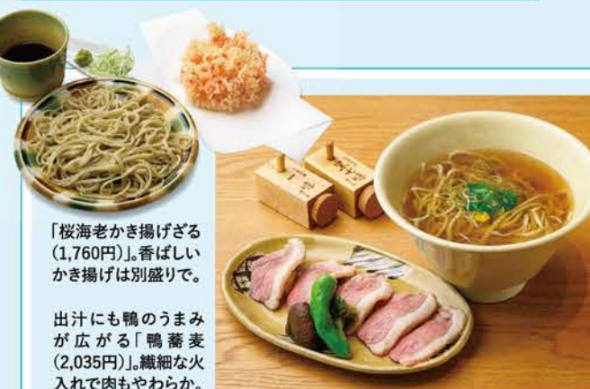
「桜海老かき揚げざる(1,760円)」。香ばしいかき揚げは別盛りで。

出汁にも鴨のうまみが広がる「鴨蕎麦(2,035円)」。繊細な火入れで肉もやわらか。