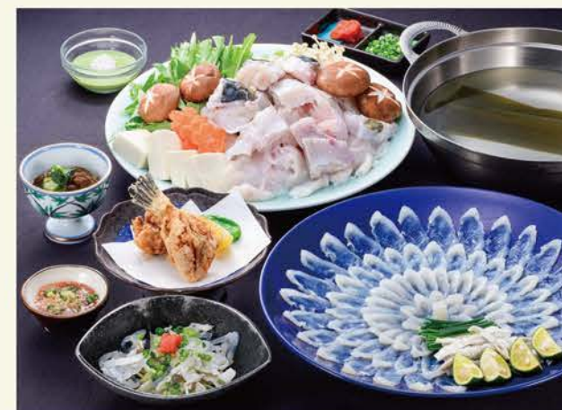
※日帰り昼食スタンダードプラン(4人前)の料理イメージ