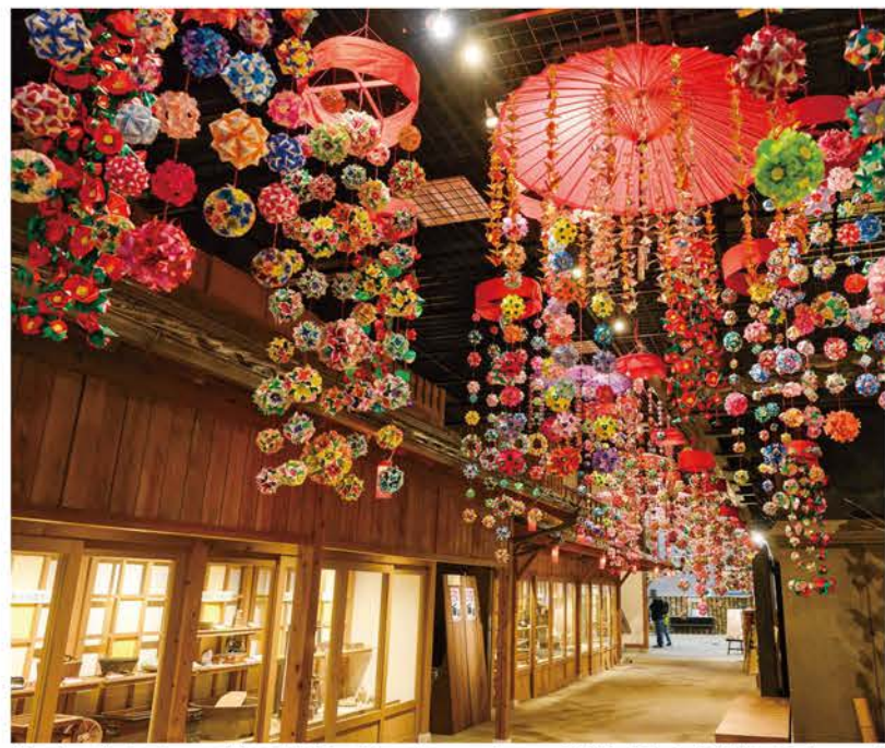
約50本の華やかなつるし飾りが出迎える「瀬戸蔵ミュージアム」。千代紙で折られた花飾りや久寿玉の中に一つだけ隠された、やきものの飾りを見つけてみて(2025年撮影)。

「ひなミッド」以外にも、「陶のまち瀬戸のお雛めぐり」の見どころは満載。「瀬戸蔵」をはじめ市内各所では、週末を中心にさまざまな手作り体験イベントが実施される。やきもの産地ならではの「瀬戸焼」の雛人形作りは、市内の製陶所や陶芸関連施設がそれぞれ異なるプログラムを用意。和紙や古布を使った雛人形作りや、米粉で作る雛祭りのお供え・おこしもの作りも人気だ。市内の飲食店34店舗では、期間限定メニューが登場。雛祭りのお祝いをイメージした彩り豊かなランチから、春らしさを感じられる和菓子・洋菓子まで、各店が工夫を凝らしたメニューでイベントを盛り上げる。