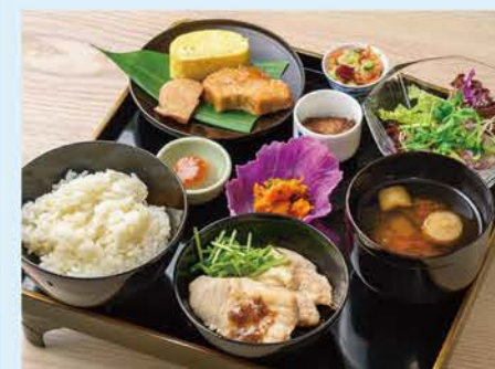
限定10食(予約優先)の「漆器プレート(1,200円)」。料理は週替わりで、+300円でドリンク付きに。

小さな路地の奥にたたずむ一軒家カフェ。赤い暖簾をくぐって店内に入ると、古民家を改装した落ち着いた空間が広がります。名物は、輪島塗のお盆と漆器で提供されるランチ。たつぷりの旬の野菜と無添加調味料を使い、ていねいに作られた料理を口にすれば、身体が喜ぶよう。ティタイムには、甘さを控えた「スパイスケーキ(350円)」や「米粉シフォンケーキ(450円)」などの自家製スイーツをどうぞ。