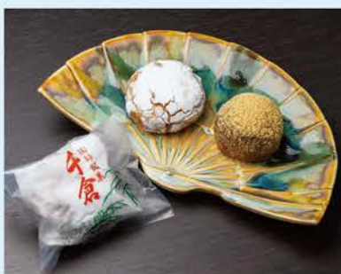
右から、喉越しの良い「わらび餅(170円)」は、シナモンが香る焼菓子「千倉(140円)」の中身は黄味あん。

「いちご大福(280円)」には愛知県産の「紅はっぺ」を使用。電話で取り置き可能。