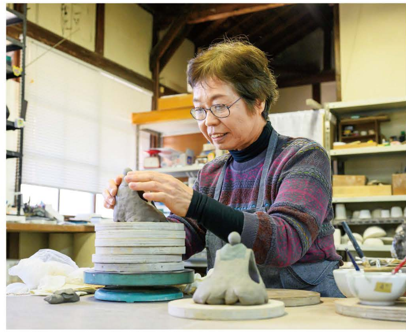
襟の部分だけでも4色の色土を重ね、着物はその都度型紙を作って粘土を切り出すなど、工程数は相当なもの。男雛・女雛の一对を作るのに約2週間かかる。