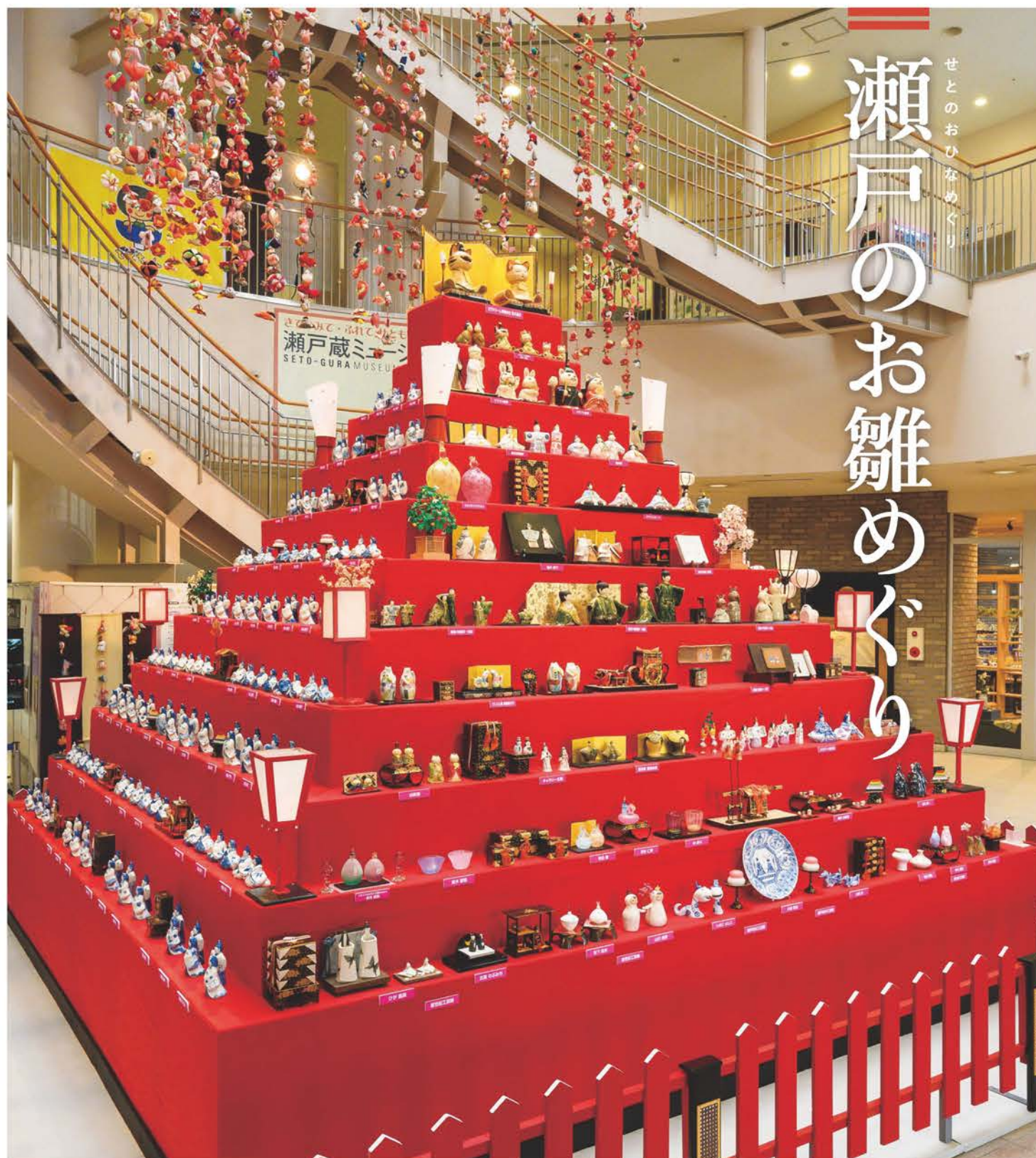
「瀬戸蔵(P4)」1階のアトリウムに設置された「ひなミッド」。4方向からぐるりと眺められる(2025年撮影)。