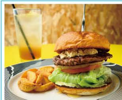
「くまバーガー(セット1,600円)」は、オリジナルスパイスをまぶした皮付きポテトも評判。

KUMA BURGER 瀬戸市薬師町43 ☎090-4257-7350 11:00~19:30(ラストオーダー) ※水曜は14:00まで 木曜休