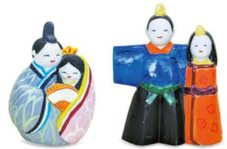
「ノベルティ・こども創造館」の絵付け体験(500円)は、カラフルなアクリル絵の具や上絵の具を使用。