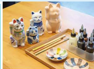
招き猫や皿・茶碗など好みの素地が選べる「磁器 絵付け体験(1,500円〜※予約優先)」。

STUDIO 894 (スタジオ ヤクシ) 瀬戸市薬師町1 ☎0561-84-0894 10:00~17:00 ※絵付け体験の最終受付は15:30、 コーヒースタンドは16:30まで(ラストオーダー) 火曜休(祝日の場合は営業)