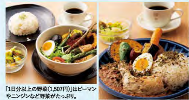
「1日以上の野菜(1,507円)」はピーマンやニンジンなど野菜がたっぷり。

独自に配合したスパイスや、スーパーフードなどを使ったスープカレー専門店。スープカレーはメインの食材が11種類、スープが4種類、辛さは1段階から選べるほか、トッピングの追加、ライスの量も調整OKと自由にカスタマイズできます。鶏や豚、野菜の旨味が溶け出した、スパイシーなスープが人気。辛味が苦手な子供用に「甘口こざるセット(715円)」もあります。