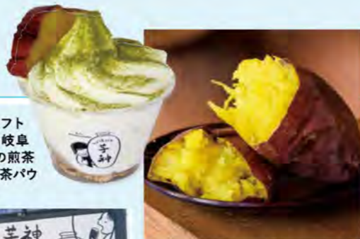
「お芋さんソフト(450円)」は岐阜県産無農薬の煎茶またはほうじ茶パウダーをオン。

昨年10月にオープンした、つぼ焼きいも専門店。隣の「すずらん助産院」が営んでおり、「子供たち、お母さんたちに安心して食べられるものを」との思いから、この店を始めたそうです。つぼ焼きいもは温かいものや、冷やし、冷凍があり、1本約