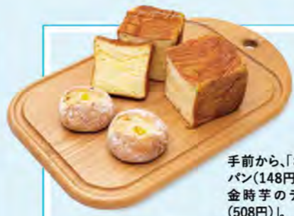
手前から、「さつま芋のパン(148円)」、「なると金時芋のデニッシュ(508円)」。

常時約80種類のパンが並び、地元で愛されるパン屋さん。とにかく自家製にこだわるといふ商品は、クリームやあんこ、カレーなど、中に詰める具材もほぼ手作り。看板商品の「うぐいす金時(558円)」は、青えんどう豆の甘露煮がぎゅーと詰まっています。徳島県産なると金時を使用した自然な甘さが特徴のパンは、秋季限定商品です。