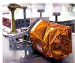
世界初の無人ランデブードッキングに成功した人工衛星「さく7号」に使用されたパーツも各務原産。

そもそもなぜ各務原市で宇宙開発も行われるようになったのだろうか。大きな理由のひとつは、飛行機とロケット・スペースシャトルに共通点が多いことだ。どちらも空中を高速で移動するため、軽く、丈夫で、熱に強い必要がある。また、飛行機とロケットのエン