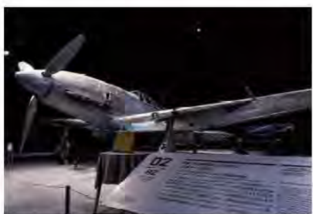
空宙博では「三式戦闘機二型『飛燕』」の現存する唯一の機体を展示。

明治36年(1903年)、ライトフライヤー号が59秒間空を飛んでから14年後の大正6年(1917年)、織沼・那加地区(現各務原市)に飛行場が開設された。「各務原の飛行場は国内で2番目に造られた飛行場で、現在も運用している飛行場としては最も古いという歴史があります」そう教えてくれたのは、宇宙飛行士の山崎直子さん。「岐阜かかみがはら航空宇宙博物館(愛称:空宙博)のアンバサダーも務めている。この辺りの土地は水田に適していないという理由から、長らく手つかずの状態だった。この広大で平坦な土地は、明治時代に入ると陸軍