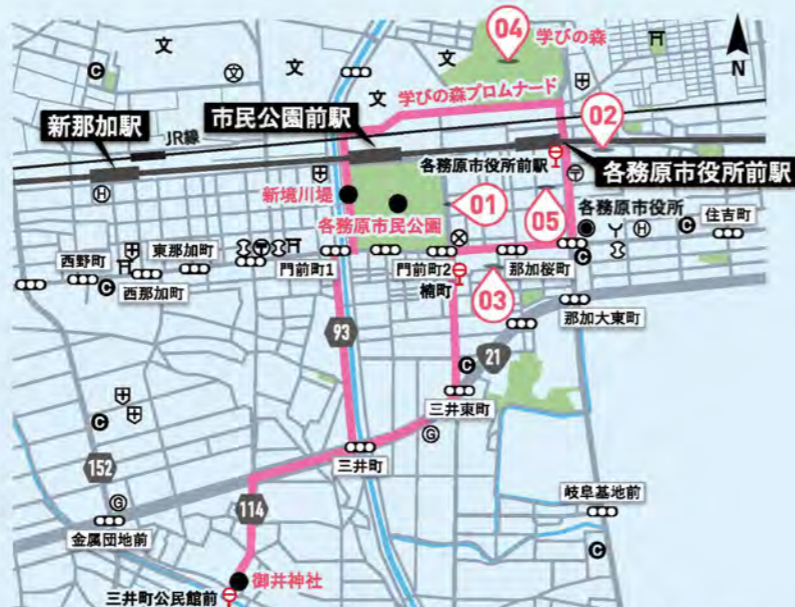
◎コンビニエンスストア ◎ガソリンスタンド