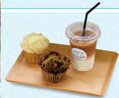
写真左から、蒸しパンの「プレーン(250円)」、「ほうじ茶チョコチップ(330円)」、「アイスマルクコーヒー(M,500円)」。

学びの森 KAKAMIGAHARA STAND 各務原市那加雲雀町10-4 ☎058-383-1531(各務原市河川公園課) ☎058-389-8979 11:00~17:00(ラストオーダー) 木曜休(祝日の場合は営業)