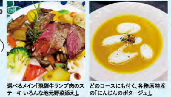
選べるメイン「飛騨牛ランプ肉のステーキ いろいろな地元野菜添え」。どのコースにも付く、各務原特産の「にんじんのポタージュ」。