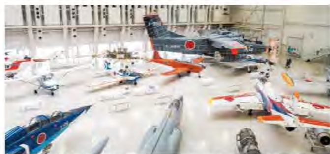
「岐阜かかみがはら航空宇宙博物館」では展示面積約9,400㎡に、実機41機、実物大模型15機の計56機を展示。実機展示数は日本一を誇っている。