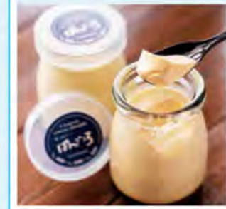
とろける食感と濃厚な味わいの「ふわとろプリン(324円)」もおすすめ。

ばんごころ 各務原市那加桜町2-307 ☎058-389-4400 9:00~19:00 日曜、第1・3月曜休