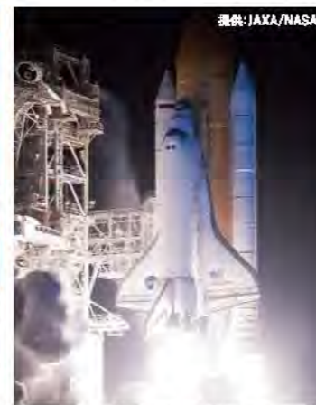
「コロンビア号」の事故から約7年ぶりの打ち上げとなった「ディスカバリー号」。