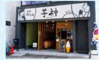
つぼ焼きいもは日によって熊本県産シルクスイートか、大分県産の紅はるかを使用。