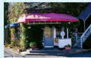
ランチは「レジェコース(3,850円)」もあります。

各務原市 かかみがはらし 名鉄名古屋駅~各務原市役所前駅へのアクセス ●犬山線犬山遊園駅または名古屋本線 名鉄岐阜駅で各務原線に乗り換え、約55分 ●片道運賃:750円 人口:145,160人(各務原市調べ) 岐阜県南部に位置し、航空宇宙産業で発展したものづくりの町。名産品に「各務原ニンジン」があり、ニンジンと松の実を使った「各務原キムチ」がご当地グルメとして知られています。