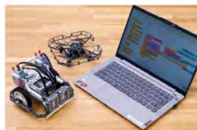
「MACH B&F」では小・中学生向けの体験教室を年に10回程度開催している。

「岐阜かかみがはら航空宇宙博物館(愛称:空宙博)」の倉庫に入ると、そこには「MACH B&F」と刻まれた小さな飛行機があった。「MII みんなで、AII 集まって、CII ちっちゃな、HII 飛行機を、BUILD & FLY II