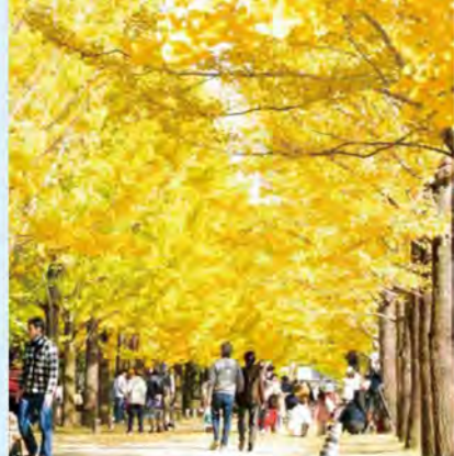
秋は「学びの森プロムナード」のイチョウ並木を目当てに外国人観光客も訪れるほどの名所。

200gで約400円。「お芋さんソフト」は輪切りとペーストのさつまいもが食べられる、秋も人気の商品です。