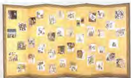
新・平家絵物語屏風