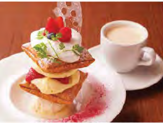
ふんわりと焼き上げるサクバリ食感のパイを積み上げた「ガトーヴァレ風ミルフィーユ(670円)」、「ブレンドコーヒー(415円)」。 ドリンクセットは50円引き。