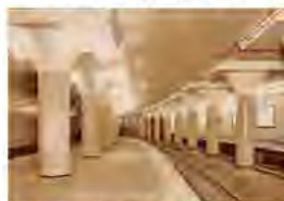
新名古屋駅(現:名鉄名古屋駅)開業当時(1941年)のホーム