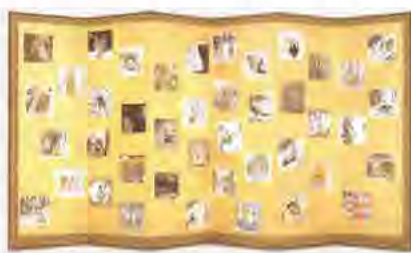
新・平家絵物語屏風