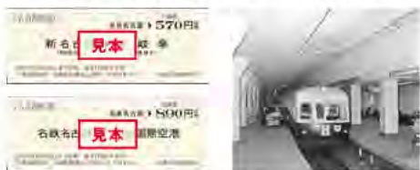
新名古屋駅に停車する5000系(昭和30年代)

名鉄名古屋駅は、1941年(昭和16年)8月、名岐線新名古屋駅として開業し、今年で80周年を迎えました。それを記念した商品を発表中です。「名鉄名古屋駅開業80周年記念乗車券」は、名鉄名古屋駅〜名鉄岐阜駅と名鉄名古屋駅〜中部国際空港駅の大人片道普通乗車券に、名鉄名古屋駅のホームをイメージしたブック式専用台紙が付きます。記念乗車券の区間は、開業時に走行した「新名古屋駅(現名鉄名古屋駅)〜新岐阜駅(名鉄岐阜駅)」となっております。台紙には開業当時のポスターや当時の写真があらわられています。なくなり次第終了となりますので、お求めは早めです。