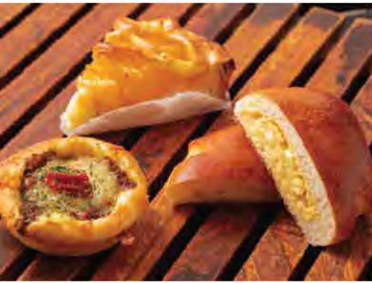
左から、厚切りのレンコンが入った「れんこんチーズカレーパン(190円)」、早い時間に売り切れることが多い「アップルパイ(220円)」、卵の風味が感じられる「歩荷さんの卵を使ったなめらかクリームパン(210円)」。