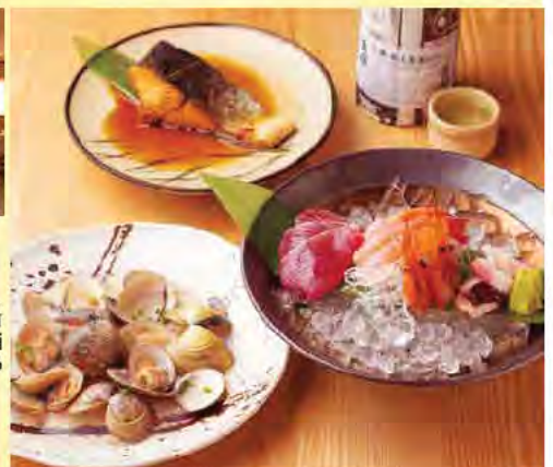
左から、日本酒に合う「はまぐりの酒むし(990円)」、ふっくらやわらかい「季節の煮魚(880円〜)」、愛西市内にある山忠本家酒造で醸造されている「義侠 生酒 純米原液(720ml、4,950円)」。3~5種類が味わえる「お刺身の盛り合わせ(1,650円)」。