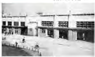
新名古屋駅外観(1941年)