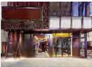
「X」を表現したエントランス