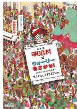
Where's Waldo?/Where's Wally? © DWA Dist. Ltd.