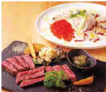
手前から、塩やワサビなどで味わう「牛ザブンスステーキ(1,100円)」、水ダコなど旬の魚介を使う「季節のカルパッチョ(990円〜)」。

愛西市北一色町昭和268-2 ☎0567-26-5188 8:30~18:00(売り切れ次第終了) ※第2~4月曜は14:00(売り切れ次第終了)、 モーニングは7:00~11:00 日曜休 http://cafearatama.web.fc2.com/ ◆佐屋駅下車 徒歩約14分