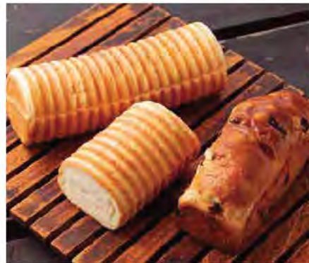
左から、しっとりふわふわで一番人気の「アラタ丸パン(1本370円、ハーフ185円)」、レーズンがゴロゴロに入った「レーズンブレッド(450円)」。