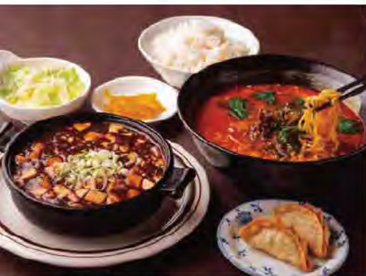
「麻婆豆腐ランチ(700円)」の麺は担々麺(写真)、台湾ラーメン、醤油ラーメン、塩ラーメンから選べます。ご飯はおかわり自由。