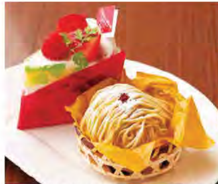
中にも上にもたっぷりイチゴを飾る「苺のスペシャルショート(620円)」と、熊本県産の和栗をペーストに使った「くりきんとん・モンブラン(500円)」。