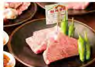
松阪牛焼肉 一升びん(11月1日開業予定)