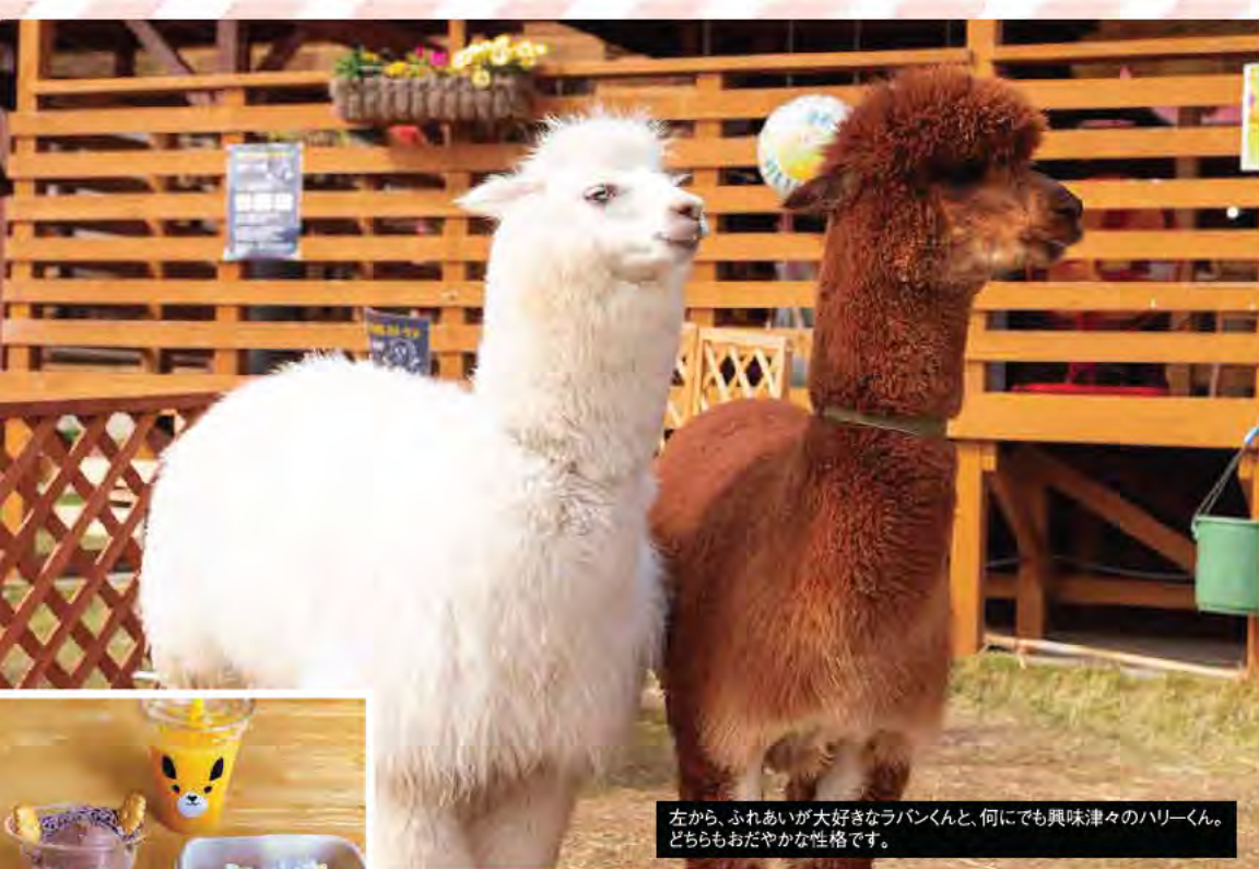
左から、ふれあい大好きなラバンくん、何にでも興味津々のハリくん。どちらもおだやかな性格です。

かわいい動物から、珍しい動物まで 気軽にふれあえるカフェを紹介。 名鉄沿線で貴重な体験をしてみませんか。