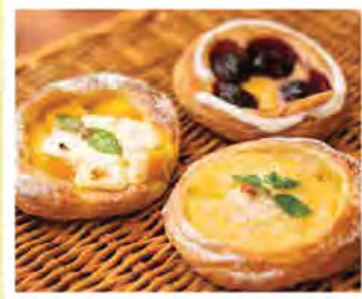
Bakery & Sandwich Cafe Aratama (P3)