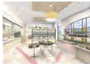
デリカキッチン(9月15日開業予定)