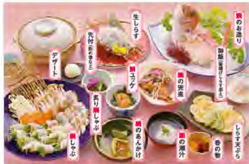
※写真の鯛のお造り、鯛しゃぶ、炙り鯛しゃぶ、生しらすは4人前です。仕入状況により料理内容の一部を変更する場合がございます。