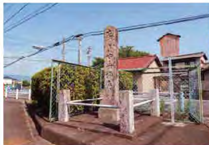
渡船場への道を示す「佐屋舟場道」の碑。昭和54年(1979年)に移築されました。