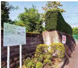
「尾張名所図会」で旅籠付近に描かれていた「きこくの生垣」が今でも残っています。当時の姿を伝える存在です。

かつて付近を幅497mの佐屋川が流れ、江戸時代には桑名で東海道と合流する航路「三里の渡し」の渡船場として繁栄していました。海の難所であった東海道「七里の渡し」と比べて安全な道であることと、三代將軍徳川家光が利用したことを機に宿場町が創設。茶店や旅籠が建ち並び、伊勢神宮へおかげ参りに行く人々であふれていたといえます。また、街道の治安や「三里の渡し」を監督する「佐屋代官所」も設置され、現在は跡地に碑が建っています。