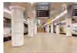
名鉄名古屋駅 現在のホーム