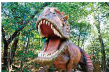
各恐竜の生態が学べる「ディノアドベンチャー名古屋」。ティラノサウルスやトリケラトプスなどお馴染みの恐竜たちのほか、3月12日に新しい恐竜プレアドンなども登場します。