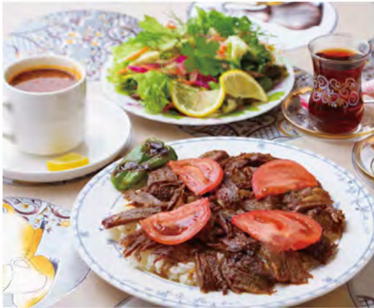
ドネルケバブの「Aランチ(1,000円)」。サラダにはトルコの野菜「ディル」が、お米にはトルコのマカロニが入り現地さながらの味に。