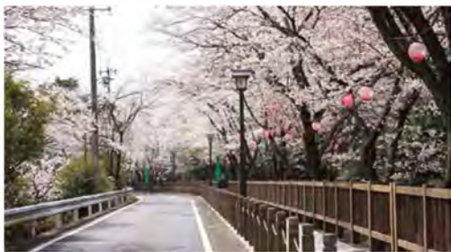
犬山城へ続く城見歩道。