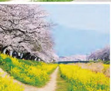
写真映えるお花見スポットとして、SNSで話題に。川原において、菜の花の近くから撮影するのがおすすめです。