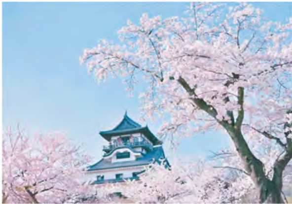
満開の桜が咲き誇る国宝 犬山城。犬山までの往復割引乗車券と犬山城入場券引換券、城下町で使えるクーポンなどがセットになった「犬山城下町きっぷ」も発売中。