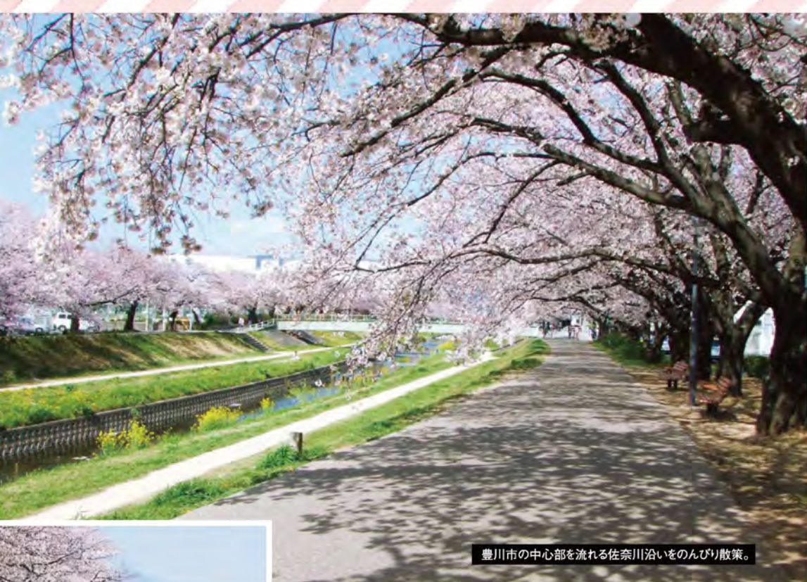
豊川市の中心部を流れる佐奈川沿いをのんびり散歩。

名鉄沿線にはお花見の名所が満載。 うらかな陽気に誘われて ふらりとお出かけしてみませんか。