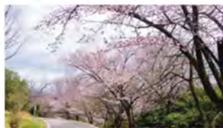
淡紅白色ソメイヨシノと白色のオオシマザクラのコントラストが見事な「若草山」。