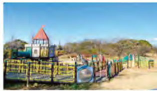
ロングスライダーなど、園内の随所に無料で遊べる子ども用の遊具があります。