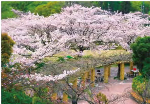
園内の南側にある「さくらの園」は、一番のお花見スポット。「さくら祭り」もこの周辺で開催されます。