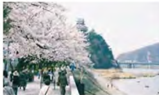
木曾川遊歩道を彩る桜並木。