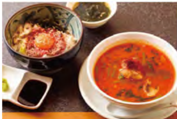
写真左から、生卵を混ぜて味わう「和牛レアハンバーグステーキ丼(780円)」、テールをホロホロになるまで煮込んだピリ辛の「和牛テールスープ 赤(950円)」。

手仕込みで作る 本場トルコのケバブ。 現地出身のオーナーが作るトルコ料理が楽しめます。看板メニューは回転焼きをした肉をご飯にのせた「ドネルケバブ(1100円)」。仕込みに時間をかけ、薄く切った牛肉をヨーグルトやニンニク、玉ねぎ、スパイスなどで作った特製ソースに1日漬け込み、しっかりと味を染み込ませてあります。ほかにも、鶏胸肉をグリルした「シシケバブ(1100円)」やスパイスの効いたハンバーグ「キョフテ(1100円)」などトルコの定番グルメがずらり。平日限定のランチは、自家農園の野菜サラダやトルコのスープ、チャイなどが付いておトクです。