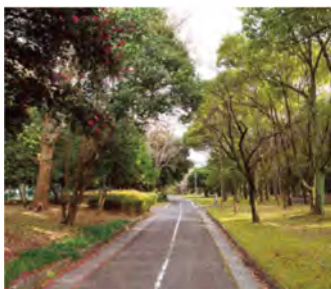
都会の喧騒を忘れる静かな遊歩道。