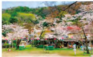
飛騨木曾川国定公園内に位置する桃太郎公園。