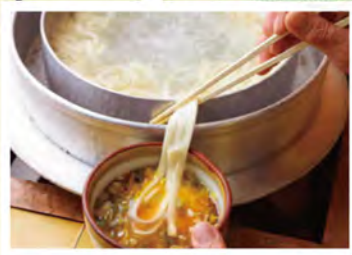
釜揚げしめん 一八(P2)