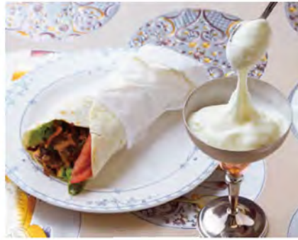
写真左から、ドネルケバブと野菜を薄いナンで巻いた「ロールケバブ(600円)」、濃厚でもちもち食感の「のび～るアイス(350円)」。