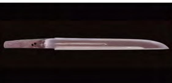
国宝の「短刀 来国俊」。来国俊76歳の作で、「熱田の来国俊」と称される逸品です。