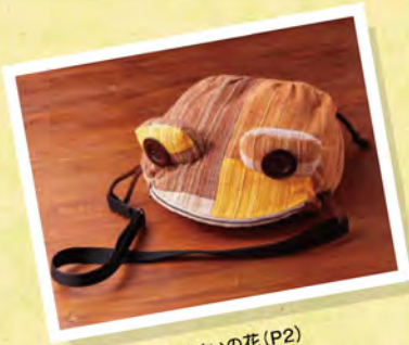
古民家カフェ もくせいの花 (P2)

貞享4年(1687年)に吉田藩主の小笠原老岐守長祐が、身分の高い人をもてなす御馳走御茶屋を開いた跡地。この地域にゆかりのある、松尾芭蕉の句碑も建てられています。 豊川市伊奈町茶屋 ☎0533-88-8035 (豊川市教育委員会生涯学習課) ◆伊奈駅下車 徒歩約8分