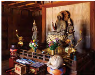
「弥陀堂」には、独特の気品を醸す「阿弥陀三尊像」が安置。格式の高い「折り上げ格子天井」と調和しています。