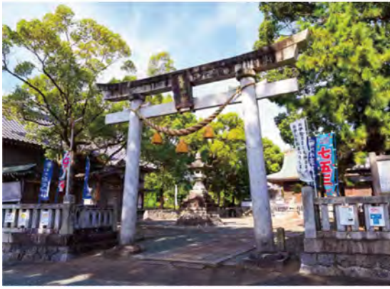
江戸時代に奉納されたと伝わる石鳥居。旧東海道沿いにあり、多くの参拝者を迎え入れていたといえます。