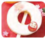
コトモファーム 犬山城三之丸店の「応縁バウム (ホワイチョコ)」600円