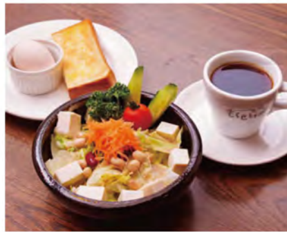
なめらかな豆腐の入った「豆腐サラダモーニング(ドリンク代+200円)」。タマゴは旨味の濃い「あつみのたまご」を使用しています。