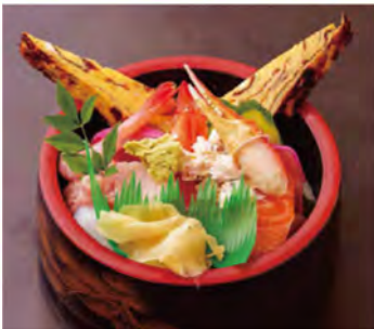
「並ちらし(1,150円)」は、写真映える華やかさ。甘めに仕上げた自家製の玉子焼きは、隠れた主役です。ネタは時期により異なります。