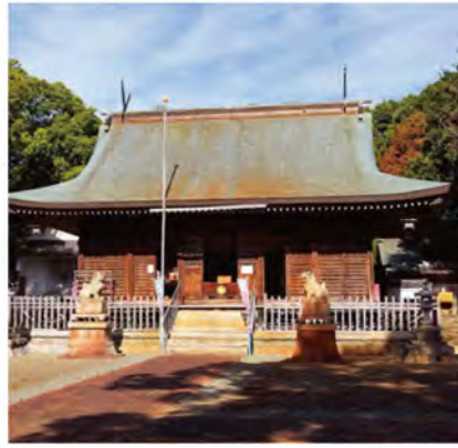
4月に行われる「風祭り」では、手筒花火などが奉納されます。本殿の前には、吹き上げた炎の勢いを思わせる、焦げ跡が見られます。