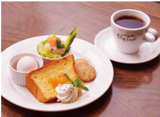
苦味が控えめで飲みやすい「ブレンドコーヒー(350円)」と、「シフォンケーキモーニング(ドリンク代+100円)」。プレーンやオレンジ、抹茶など6種類から日替わりで登場します。ゆで卵とミニサラダ、手作りクッキー付き。