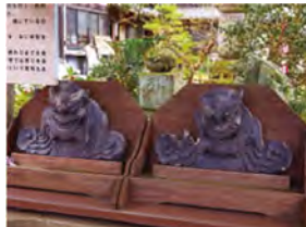
「弥陀堂」が瓦葺きに改修されていた頃に使われていた「阿吽(あうん)の鬼瓦」。