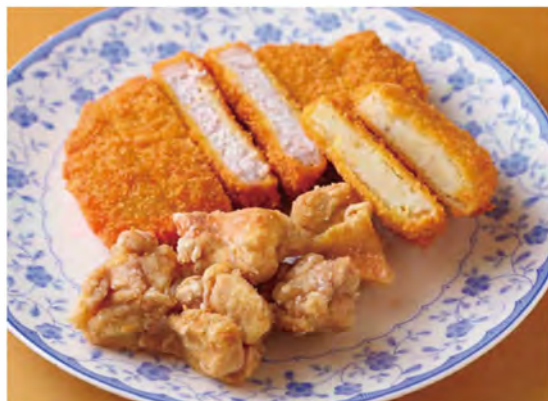
写真手前から時計回りに、塩コショウのみで味を付けた「とりモモからあげ(1個約60円)」、やわらかい「ロースとんかつ(約350円)」、北海道産男爵いもの「コロッケ(1個80円)」。揚げ物は11時~12時30分、16時~18時30分に販売。