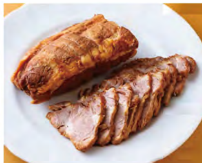
「秀麗豚」を秘伝のタレで煮込んだ「焼豚(100g450円)」。やや甘めのあっさりしたタレが、ジューシーな豚肉とよく合います。写真は約450g2,025円。