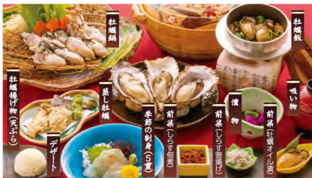
※牡蠣鍋は3人前です。仕入れ状況により料理内容の一部を変更する場合がございます。ごどもは別料理となります。

伊勢湾と三河湾に挟まれた篠島は、漁獲量日本一を誇るしらすをはじめ、ふぐや鯛など、海の幸に恵まれた島。愛知県で初めて養殖が始まり、徐々に冬の定番となりつつある牡蠣を、たっぷり堪能できる「でんしゃ旅 篠島の旬 牡蠣御膳」が1月~3月限定で登場!! 名鉄電車と名鉄海上観光船(河和港⇄篠島港間)のフリーきっぷに、特別車両券(ミュウチケット)割引券がセットになり、大変おトクです。食事は、蒸し牡蠣や牡蠣鍋、牡蠣飯に、季節の刺身など全11品。篠島では、レンタサイクルなどの割引特典を使った島内観光もおすすめ! 近場の旅をおトクに満喫しましょう。