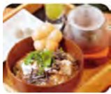
犬山よあけやの「めで鯛茶漬」980円