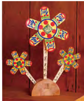
五穀豊稔の縁起物「風車(大1,000円、小700円)」。羽は「米俵」を、裏に付いているガラガラは「打ち出の小槌」を表現。

この地域を開拓して「穂の国」を作ったとされる菟上足尼命をご祭神とする神社。白鳳15年(686年)に神社をこの地に移した秦石勝は、始皇帝の遣いで中国から来た人の子孫なのではないかという伝説もあります。稲の豊作を祈る県指定無形民俗文化財の「田祭り」や、「今昔物語」に紹介される「風祭り」といった伝統ある祭りが毎年執り行われ、仕掛け花火発祥の地としても知られています。1月1日には「元旦祭」があり、2022年は金と銀の「御朱印(1枚各500円)」が授与されます。