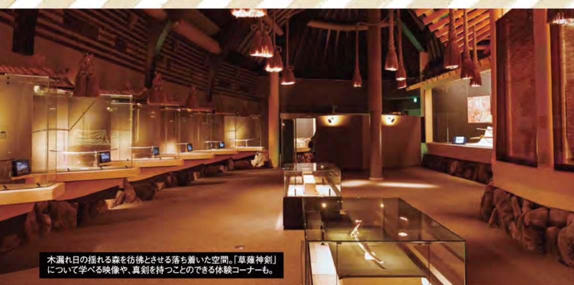
木漏れ日の揺れる森を彷彿とさせる落ち着いた空間。「草薙神剣」について学べる映像や、真剣を持つことのできる体験コーナーも。

名鉄沿線は文化財の宝庫。 貴重な建築物や美術工芸品が、 歴史と文化を今に伝えていきます。