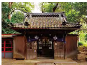
本殿から北にのびる参拝道の先には、「奥の院」がたたずんでいます。