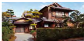
数寄屋造りの「坐漁荘」。要人の邸宅ならではの防犯対策も。