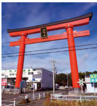
遠くからでも目を引く大鳥居。21.6mあり、愛知県で2番目の高さです。

— 明暦年間(1656年頃)に起源を持つ神社。文政13年(1830年)に「伏見稲荷社」から勧請した、宇賀之御魂神や宇迦之売神など五柱の御祭神を祀り、五穀豊穣や商売繁盛などにご利益があるといわれています。本殿のある小高い丘は、弥生時代中後期に造成された「五社稲荷古墳」。幸せを運ぶとされる「福だるま」おみくじだるま(500円)など、古くから伝わるお守りや縁起物もあります。1月1日～13日まで「元旦祭」が行われ、出店も並ぶ予定です。