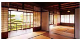
「坐漁荘」の2階座敷から、美しい庭園と入鹿池を一望。