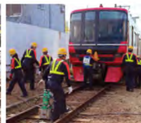
脱線した車両をジャッキを使用して、線路に戻す訓練。