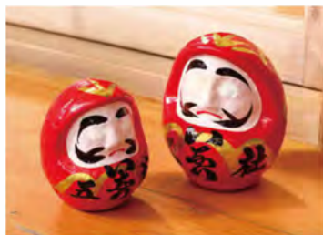
「福だるま(3号500円、4号1,000円)」。他地域のだるまと比べて顔が大きいのが特徴です。