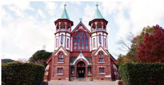
京都から移築された「聖ヨハネ教会堂」。竹のすだれを取り入れた礼拝堂は、明るく開放感があります。

平安時代の優美な 国宝の仏堂を参拝。 戦乱の世を鎮めるため、源頼朝の命により安達盛長が文治2年(1186年)に創建。同時期に建てられた「三河七御堂」のうち唯一残存している仏堂で、愛知県で最も古い木造建造物の国宝です。平安時代の貴族住宅の影響を色濃く残す建築は、美しく洗練されたたたずまい。細部にまで職人の技が宿り、小規模ながらも見どころがたくさんあります。屋根は江戸時代に一度瓦葺きにしましたが、昭和29年(1954年)に檜皮葺に復元され、現在の姿に。建物の中に鎮座する瑞々しい表情の「阿弥陀三尊像」は、愛知県の重要文化財に指定されています。