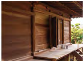
上開きの扉「蓐戸(しとみど)」は、平安時代の寝殿造りでよく用いられていたといひます。