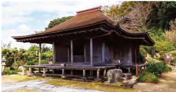
屋根は「縫破風(すがるはふ)」で、変化に富んだ美しい曲線が目を引きまします。