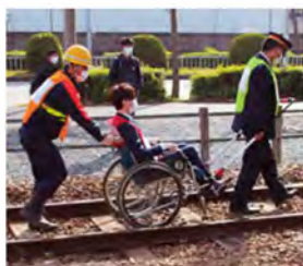
車いすをご利用のお客さまを安全かつ迅速に避難誘導できる簡易装着型けん引式車いす補助装置「JINRIKI®QUICK」を使用した訓練。

その一環として2021年11月19日、走行中の列車が踏切において乗用車と接触、脱線したケースを想定し、災害事故総合復旧訓練を実施しました。事故発生時のお客さまの安全確保や関係部署間の情報収集・展開をはじめ、列車内における新型コロナウイルスの感染予防対策、お客さまの避難・誘導、保守部門の担当者による復旧作業などを行いました。