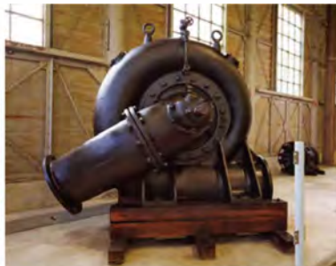
「機械館」に展示されている「あのかち渦巻ポンプ」。効率性と機能性に優れていた井口式渦巻ポンプの、最初期かつ現存最古の伝存例です。