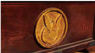
境内に40箇所以上あるウサギの装飾を探すのも、楽しみのひとつです。

お賽銭箱などにあるウサギの飾りがかわいいです。本殿にはウサギの大きなオブジェも。国道1号線の近くにあるにも関わらず、静かで落ち着いた雰囲気も気に入っています。