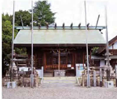
毎年11月の第4日曜日に新嘗祭が執り行われ、見学もできます。今年は11月28日に開催。