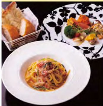
左から、「取り分けグランデコース(3,740円、2名〜)」で味わえる、「ずわい蟹と季節の野菜のオイル仕立て」と「前菜盛り合わせ」。

ずらりと並ぶ生豆から自分好みの香りや味を。 今年3月にオープンしたコーヒー豆の専門店。フェアトレードで仕入れる豆やスペシャルティグレードの豆などを中心に、香りや酸味、苦味、力強さなどの異なる23種類のコーヒー豆が並び、900円~1300円とリーズナブル。生豆の状態でも販売され、購入後に店内で焙煎。香りの高い状態で味わえるのが魅力です。5種類の生豆から好きな豆を選び、好きな割合で組み合わせる「オリジナルブレンド」は、贈り物にもぴったり。また、カフェスペースでは、「スマスマモーニングセット」「今週のワンプレートランチ(700円〜)」などもあります。