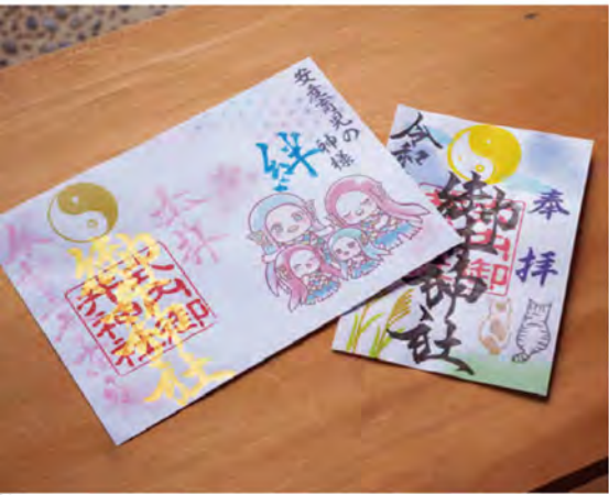
左から、疫病退散を願う「アマビエ御朱印(600円)」、月替りの「通常御朱印(400円)」。

極上の素材で紡ぎ出す 洗練されたスイーツ。 パリを彷彿とさせる空間に並ぶ、色とりどりのケーキやマカロンにうっとり。オーナーパティシエの滝本真氏は、地元岐阜の有名店やフランスの名店で修業した後、世界的に知られる青木定治氏のもとで腕を振るった実力派。シヨコラはイタリア「ドモリー社」の高品質なものを、香り付けに使うラム酒は最高等級「V.S.O.P」を使用するなど、素材一つひとつを厳選し目でセレクト。フランス菓子をベースに独自の感性を織り交ぜたケーキは、麗しい見た目はもちろん、しっとり濃厚で満足感のある逸品です。