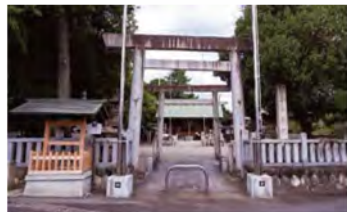
境内へと続く橋は、往路が「ねがい橋」、復路が「かない橋」と呼ばれています。