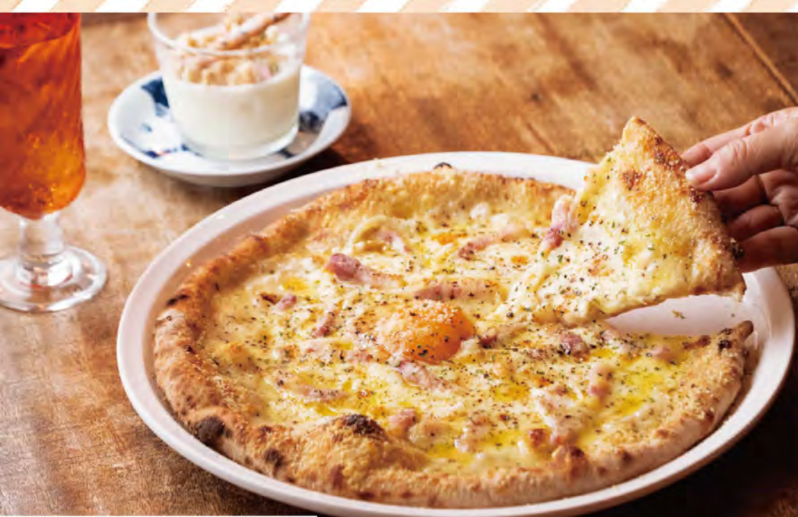
卵黄を全体に絡めて味わう「カルボナーラ ピッツァ」(1,800円)。デザートにおすすめの「トコニューコッタ(550円)」。「ジンジャール辛口(390円)」はランチタイムには150円に。