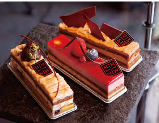
左から、フランス産の栗を使用した「マロン(600円)」、赤桃のムースとショコラを合わせた「アメリカ(550円)」、ショコラを使った「モロゴロ(580円)」。