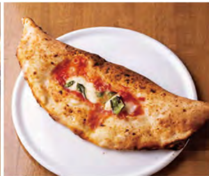
自家製リコッタチーズがとろける、包み焼きピザ「リビエノ・ノルマーレ(1,485円)」。