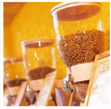
自家焙煎珈琲豆販売 & Cafe SMILE DE SMILE (P3)