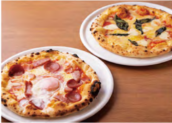
左から、サラミヤソーセージ、ベーコン、卵がのった「ビスマルク(1,210円)」、あっさりしたトマトソースベースの「スペシャルマルゲリータ(1,375円)」。