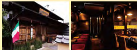
左から、「ドルチェット ダルバ(ボトル5,060円)」。ディナーメニューの「ニュージーランド産仔羊のロースト 赤ワインソース(1,870円)」、「ハンガリー産鴨のスマークと季節のフルーツのサラダ仕立て(990円)」。