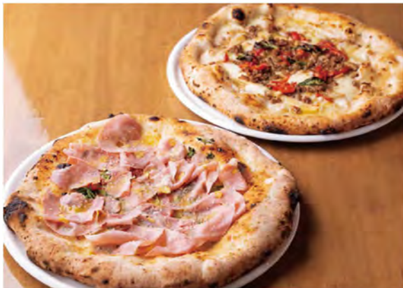
左から、ここでしか味わえない「チェッコ(1,980円)」。エリンギや甘い挽肉をトッピングしたオリジナルピザ「マッキナート(1,485円)」。