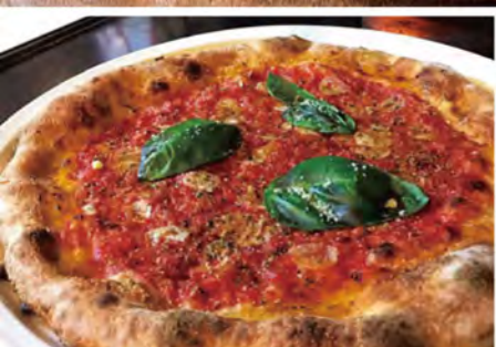
「マリナーラ(980円)」。チーズがのっていない分、生地そのものの味わいを存分に楽しめます。