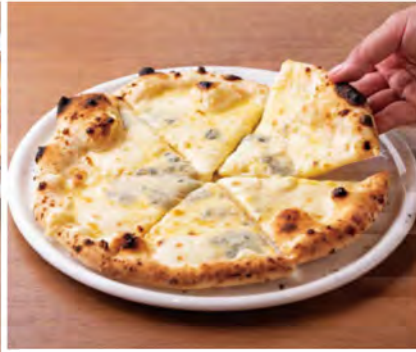
「クアトロフォルマッジョ(1,430円)」。モッツァレラチーズとゴルゴンゾーラチーズ、ゴダーチーズ、マスカルポーネチーズによる、奥深い味わいです。