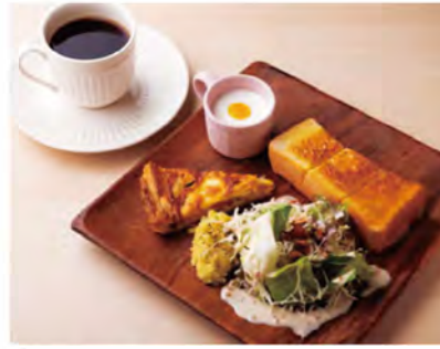
自家焙煎した豆を使用した飲みやすい「ブレンド珈琲(500円)」。モーニングタイムは、ドリンク代でキッシュやトーストの付く「スマスマモーニングセット」に。

「オリジナルブレンド(200g1,000円)」。焙煎時間は約20分、浅煎りや深煎りといった焙煎度もリクエストできます。