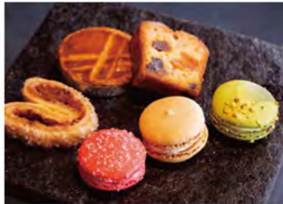
手前左から、スペインの生アーモンドを生地に練り込んだ「マカロン(各280円)」、純度の高いバターを使った「パルミエ(240円)」、フランスの伝統菓子「ブルトヌヌ(260円)」、漬け込んだフルーツが入った「ケーキ オ フリュイ(280円)」。