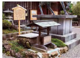
かつては、五穀豊穡・集落の繁栄を祈願する三井川の清流が湧き出していた「神水の和泉」。