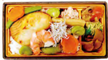
企画:名鉄観光サービス・碧南市観光協会 弁当調製:名古屋エアケータリング