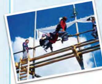
高さ9mの櫓と梯子の上で2人1組の獅子が、お囃子に合わせて曲芸を披露します。

牟山神社(むさんじんじや) 知多市新知東屋敷2 ☎0562-51-5637(知多市観光協会)