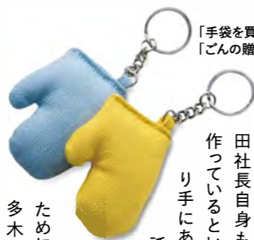
「手袋を買いにキーホルダー(各990円)。「ごんの贈り物」で購入可能。