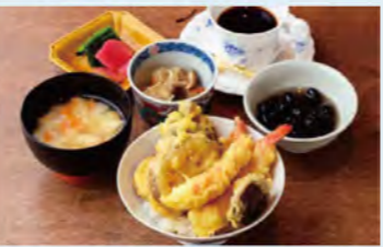
「井ランチ(1,100円)」。写真は海老やキノコ、季節の野菜天ぷらを使った天井。

割烹 川上 知多市朝倉町283 ☎0562-36-0072 11:30~14:00、18:00~21:00(ラストオーダー) 火曜休、12/29~12/31、1/4~6 ※1/1~3はお正月料理(要予約、6,000円~)のみ営業