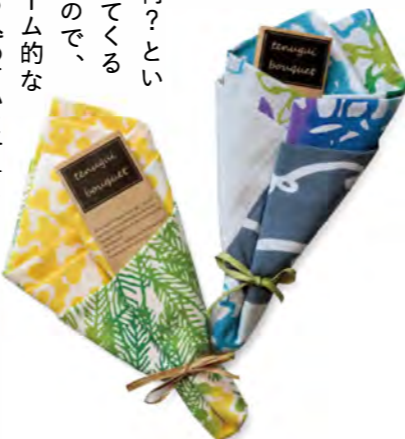
手ぬぐいを花束に見立てた「tenugui bouquet(ミモザ・アジサイ各1,980円)」。

綿って何？という人が出てくると思ったので、シヨールーム的な意味合いも込めています」と話す。店を構えたのは古い街並みを残す岡田地区。「『知多木綿』の魅力は伝えたいのと同時に、木綿の街として栄えた岡田をPRしたい。町を活性化させながら『知多木綿のふるさと』として、またにぎわってほしいという願いがあります」と目を輝かせて語った。