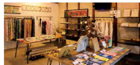
旧中七木綿本店跡地にある「知多木綿」の専門店。自社製品と、「知多木綿」を使って全国で染色・加工された商品のみを取り扱う。