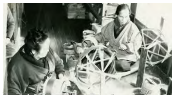
綿から糸車を使って糸を紡いでいく様子。

が広まった。当時は仕事としての糸紡ぎから機織りに加え、自家用に藍染をした綿木綿を織ることも女性の仕事。一家に一台は「ハタゴ」と呼ばれる織り機があり、「機を織れぬものは嫁に行けぬ」といわれたそうだ。明治時代中期になると工業化が進み、自動織機が普及。副業から知多地域の産業として発展した。最盛期には約700件もの織布工場があり、松阪・泉州と並ぶ三大綿織物生産地となった。