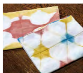
常滑の土と知多の藍で染めた「知多のトリコロール」の手ぬぐい(試作品)。