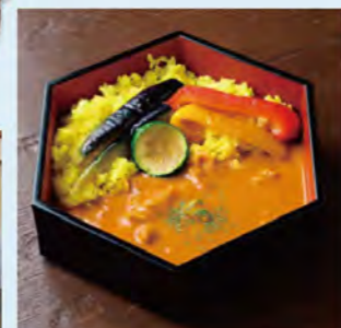
「やさしいカレー(880円)」は玉ネギやセロリ、ジャガイモなど野菜の旨味を凝縮したトマトベース。

オーナーの「地域みんなの抛り所になる場所を」との思いで誕生した、「どら焼き」Cafe Novatani」監修の特製カレーが人気の店。どら焼き生地は材料を入れる順番や混ぜ方、焼き時間などを試行錯誤して完成させました。銅板で一枚ずつ手焼きし、手作りのあんこやホイップクリームなどをサンド。近隣のイベントにも多数出店しています。