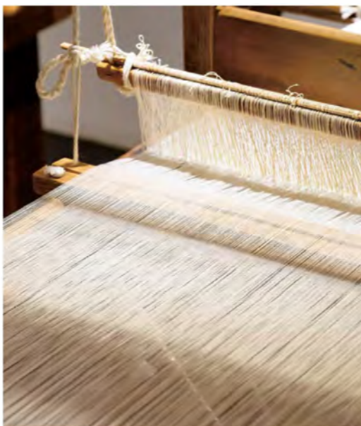
地域によってハタゴの形は多少異なり、知多のハタゴは華奢な造り。手織りの木綿は風合いが良く、大変評判が高かったそうだ。