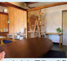
イートイン可能で、座敷席とテーブル席を完備。絵本もたくさんあります。

てくてく庵 知多市朝倉町185 ☎0562-77-0988(児童発達支援事業所nicoと共用) 10:30~14:00(ラストオーダー) ※土曜は11:00~16:00(ラストオーダー) 日曜・月曜休、祝日休(祝日が土曜の場合は営業)、12/29~1/5休