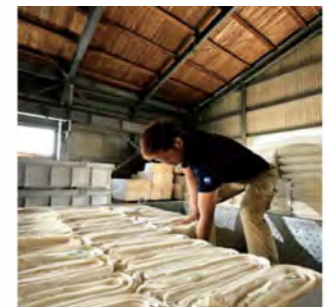
現在の晒の作業。漂白とは異なり、織布過程でついた糊や油を洗い落とす工程。

暮らしの至るところに「知多木綿」が使われている理由のひとつに、時代のニーズに合わせた高い技術力がある。ガーゼのような薄い生地から、帆布のような厚い生地まで、ここ知多地域ではかねてより織られてきた。また木綿