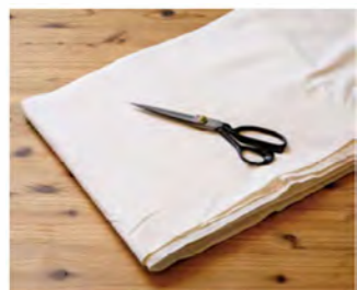
手ぬぐいや浴衣用に織られる生地は幅が狭く、小幅生地と呼ばれる。

知多地域での織布技術の総称として用いられる「知多木綿」。織りあがった状態は生色だが、薬品で油や糊を洗い落とす晒を施すことで真っ白な生地が完成する。この白く染めやすい晒生地が特徴のひとつである一方、糸を染色して織りあげた布もまた「知多木綿」である。そして、幅37cmほどの小幅生地も「知多木綿」が得意とするところだ。吸水性に優れ、肌触りが良い薄めの生地は、手ぬぐいや浴衣、ふんどし用に。丈夫な厚めの生地は、