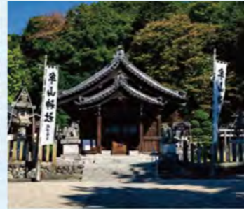
昭和31年(1956年)に建て替えられた拝殿には、伊勢神社殿の古材を使用しています。