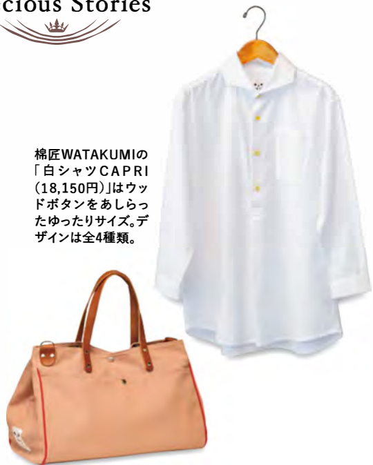
棉匠WATAKUMIの「白シャツCAPRI (18,150円)」はウッドボタンをあしらったゆったりサイズ。デザインは全4種類。