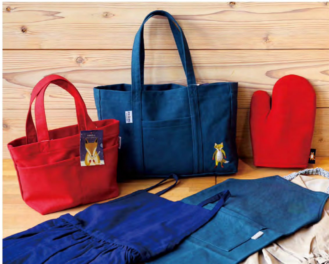
cafe&shop「ごんの贈り物」とのコラボ商品は、「新美南吉記念館」で購入可能。