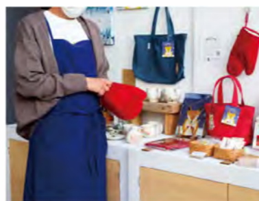
「ごんの贈り物」スタッフエプロンも製作。