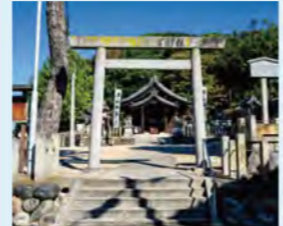
祭神として天御中主命、大己貴命、少彦名命を祀っています。

文永3年(1266年)に創建されたと伝えられる、歴史ある神社。漁業の海上鎮護や豊年豊作を祈る神様が祀られ、朝倉地域の氏神として信仰を集めてきました。慶長3年(1598年)に、村民たちが梯子(はしご)を作って猪(獅子)を退治したおかげで大豊作となったことから、大祭神事「朝倉の梯子獅子」を行うように。現在では毎年10月第一日曜に開催されています。