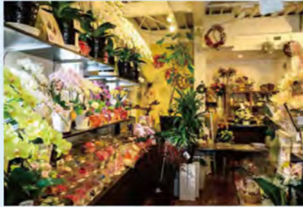
贈り物に最適な生花や鉢植えのほか、ドライフラワーなども販売しています。

花の生華園(せいかえん) 知多市にしの台1-1209-1 ☎0562-55-8787 9:30~18:00 水曜休、12/31~1/5休