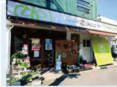
注文は電話のほか、公式アプリやLINEアカウントからも受付。