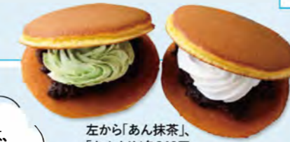
左から「あん抹茶」、「あんくり」各240円。