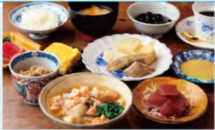
「週替わりランチ(1,650円)」。1月はカブラの海老あんかけなどを予定。

「非日常感を味わってほしい」との思いから、漬物や調味料に至るまでほぼ手作り。重厚なクルミの木のカウンター席からは、見事な手さばきで調理する様子を眺められます。料理はシンプルながらも素材の味をていねいに引き出した上品な味わい。ディナーは要予約で、「おまかせコース(4000円)」となります。