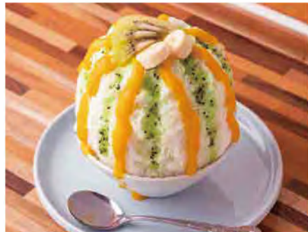
夏季限定の「トロピカルストライプス(1,100円)」。さっぱりとした味と、パイナップルソースとキウイソースの鮮やかなビジュアルが夏らしい一品です。

特典 かき氷をご注文の方に、トッピング(小倉、バナナ、追い練乳)1種類をサービス。