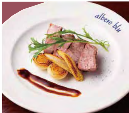
「豚肩ロース肉のソテー(1,100円)」。肉汁を閉じ込めるように焼き上げるため、しっとりとしゅーしゅーな仕上がります。