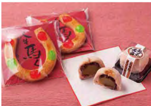
「蹄鉄クッキー(1個160円)」は笠松菓子工業組合の各店舗でも販売しています。「おぐり大福(1個180円)」は、伝説的な最終レースで有終の美を飾ったことから受験のお守りにも重宝されています。

甘さ控えめを心掛けています。生菓子は見た目も美しく、好評。最近は10代の若いお客さまもたくさん来店いただいています。