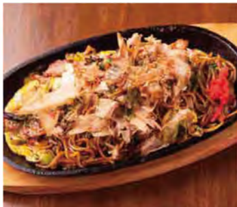
「やきそば(650円)」は、コクのあるソースが決め手。熱気を受けて踊る花ガツオが食欲を誘います。

ここのかき氷は、ふわっとしていて美味しい!いろいろな種類がありますが、「ミルクいちご(770円)」がお気に入りです。イチゴの果肉とミルクとの相性が抜群!