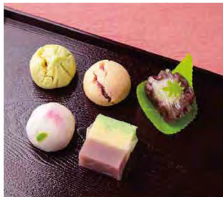
「季節の生菓子(1個180円)」は、常時約10種類。6月は、初夏を思わせる清流やあじさいをモチーフにしたものが並びます。