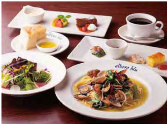
「本日のパスタコース(1,500円)」。写真は「あさりとほうれん草のペペロンチーノ」。前菜、サラダ、パン、デザート、ドリンクが付き、ボリューム満点です。

昼夜とも予約がおすすめ。グラスワイン(500円)やスパークリングワイン小瓶(1,400円)などのお酒と一緒に楽しむ人も多いです。