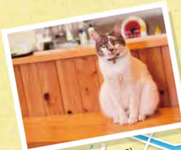
ごはん居酒屋 いろんなん(P3)