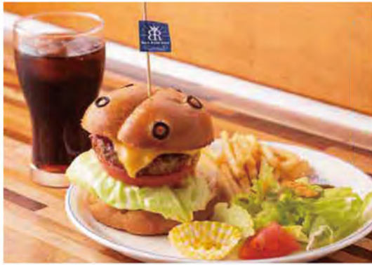
チーズやトマト、レタスを挟み、自家製BBQソースで仕上げた「オリジナルホーシューバーガー(900円)」。写真のドリンクセットはプラス220円。