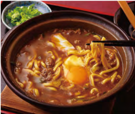
「国産牛すじ カレー煮込みうどん 生卵入り(1,050円)」。あっさりしたカレースープに、やわらかく煮込んだ牛すじのコクとコーラーゲンが溶け込んでいます。