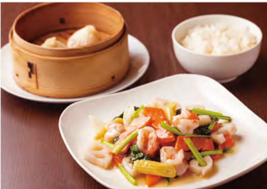
肉汁あふれる小籠包の付いた「海老と季節野菜炒め・小籠包set(1,045円)」は、エビと小松菜などを炒めた、やさしい旨塩味です。野菜は仕入れにより異なります。