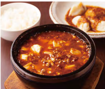
「石焼き麻婆豆腐・水餃子set(1,045円)」。山椒が効いたシビ辛の麻婆豆腐は、辛さの調節も可能です。ごまダレのかかった、もちもちの水餃子付き。

現在、夜は貸切営業のみで、シェフおまかせ広東料理コースがおすすめです。1月2日・3日の夜は予約優先で特別営業。コース以外もOKです。