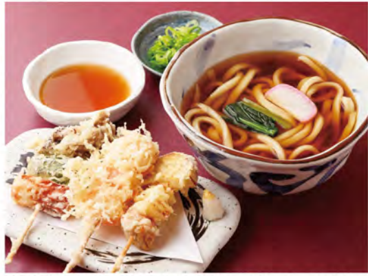
「串天(3本)うどん(850円)」。写真の「串天」は、マイタケ・ピーマン・ちくわ、エビ、ジャガイモ・タマネギ・カボチャ。