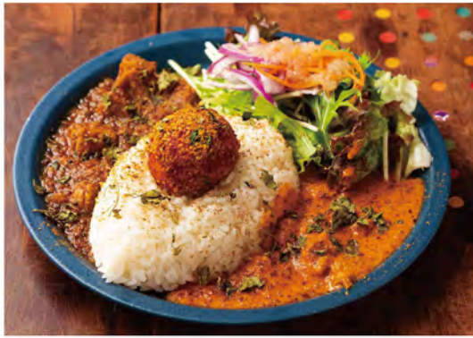
あいかけカレーとサラダのプレートランチ「Bセット(1,243円)」に、「スパイスたまご(165円)」をトッピング。写真は中辛の「スパイスポークカレー」と甘口の「バタークリームチキンカレー」。