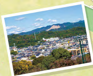
弘法山公園からの眺望