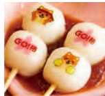
むすび茶屋の「応援団ご」385円