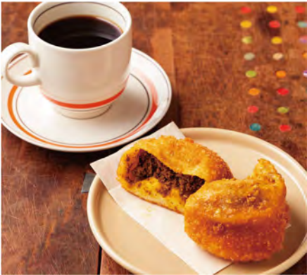
浅煎りと中煎り、深煎りから選べる「コーヒー(495円〜)」、もちっとした生地でスパイシーな「カレーパン(330円)」。