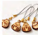
木のお店 デザインモリスの「開運招福 福ふくストラップ」704円