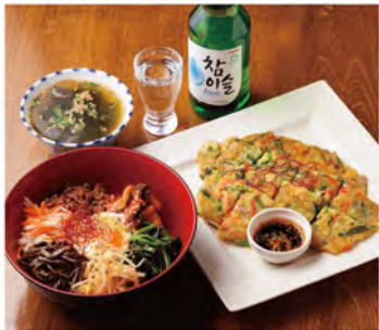
手前左から、手作りのナムルがのった「ピンパ・スープ付(748円)」、韓国焼酎「チャミル ボトル(770円)」、もちっとした「チヂミ(638円)」。