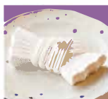
桜屋菓舗の焼き菓子「結い」500円