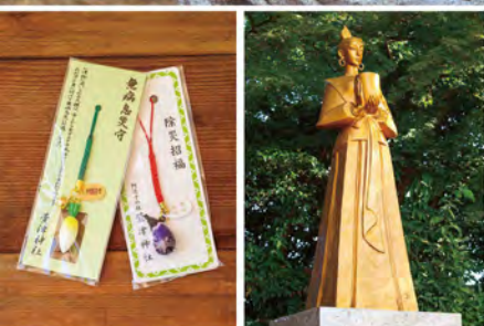
写真左は、「無病息災守(ダイコン守)」、「除災招福守(ナス守)」初穂料各500円。写真右は、鹿屋野比売神の像。