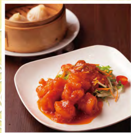
Lam Tin (P2)