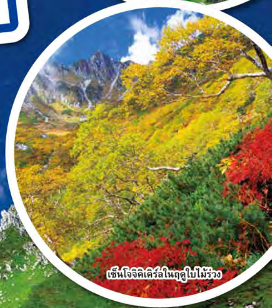
เซ็นโจจิเคิร์ลในฤดูใบไม้ร่วง