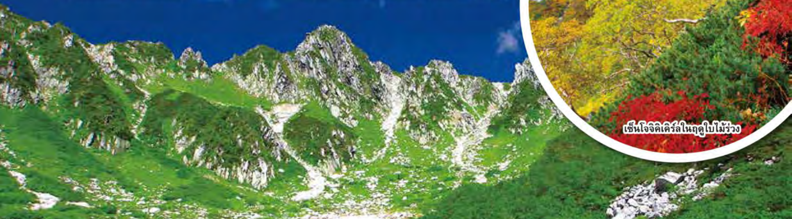
เซ็นโจจิเคิร์ลในฤดูร้อน

เดินทางกลางฟ้าเป็นเวลา 7 นาที 30 วินาทีต่อเที่ยว ให้คุณได้ชื่นชมภาพพาโนรามาอันยิ่งใหญ่ที่อยู่เบื้องล่าง