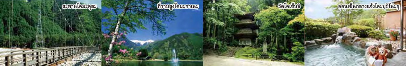
สะพานโคมะคุสะ

*รูปทั้งหมดเป็นภาพจำลอง