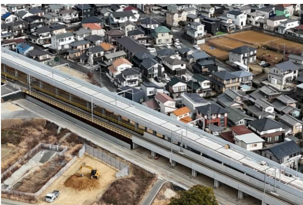
若林高架知立方 本線および仮線