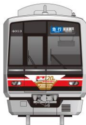
車両前面イメージ

装 飾：瀬戸線の往年の車両(モ 900 形、ク 2300 形、ク 2320 形の 3 形式)で掲出していた「逆さ富士」ヘッドマークをイメージした前面ステッカーのほか、車両側面にはかつての車両写真をボディーステッカーにして掲出します。