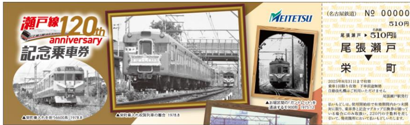
記念乗車券イメージ