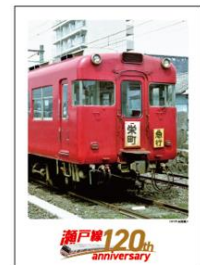
ボディーステッカーイメージ