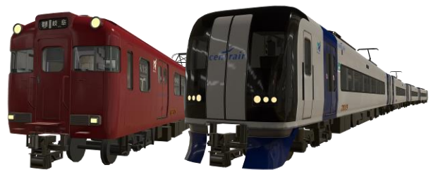
《再現した名鉄電車（左：6000系、右：2000系）》