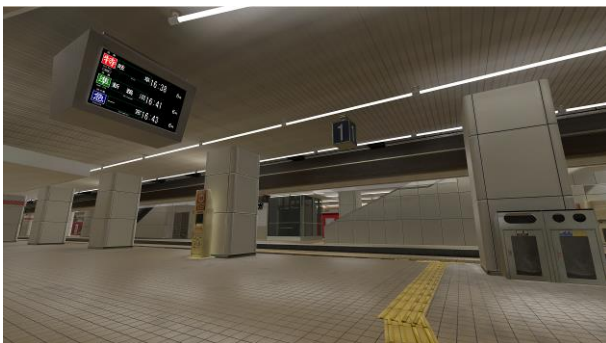
《再現した名鉄名古屋駅のホーム》