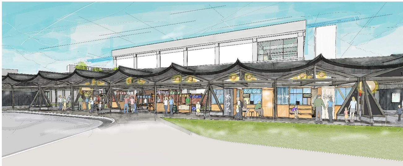
※西側から見た参の戸エリア(イメージ)

第1期開業予定のエリア「参の戸」は、長屋根の下に、飲食、物販、食物販等のワゴン群が立ち並ぶエリアです。また、敷地内に常設のキッチンカースペースを予定しています。このエリアについて、テナント募集を実施しています。