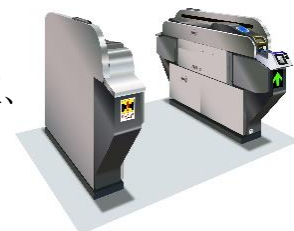
自動改札機 設置イメージ

本件は、名鉄グループ中期経営計画「Turn-Over2023 ~反転攻勢に向けて~」(2021~2023年度)の重点テーマに掲げる「交通事業の構造改革」および「DXの推進」の一環として取り組むものです。