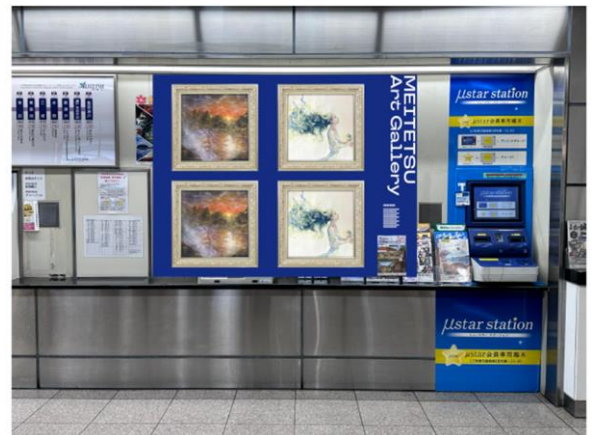
「2.5GALLERY 4台」設置イメージ(栄町駅)

栄町駅、大曾根駅、小幡駅に設置する QR コードまたは投票サイトから投票 URL: https://hackktag.com/news/1700731798484x951310292306886700