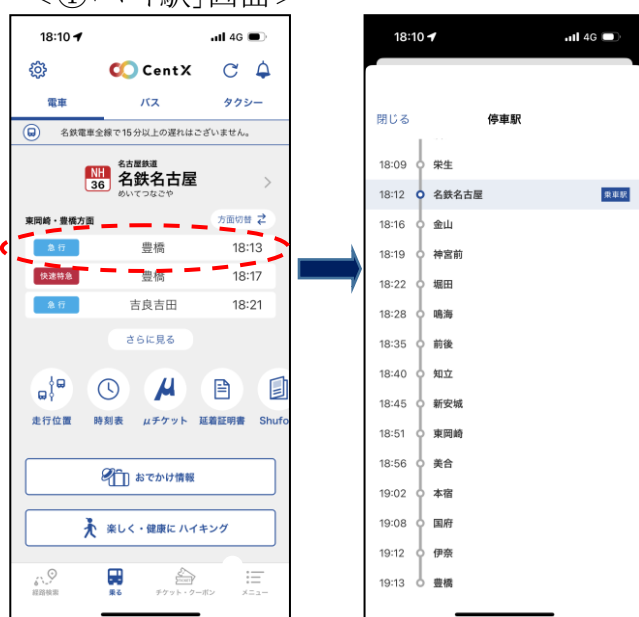
直近 3 本時刻表