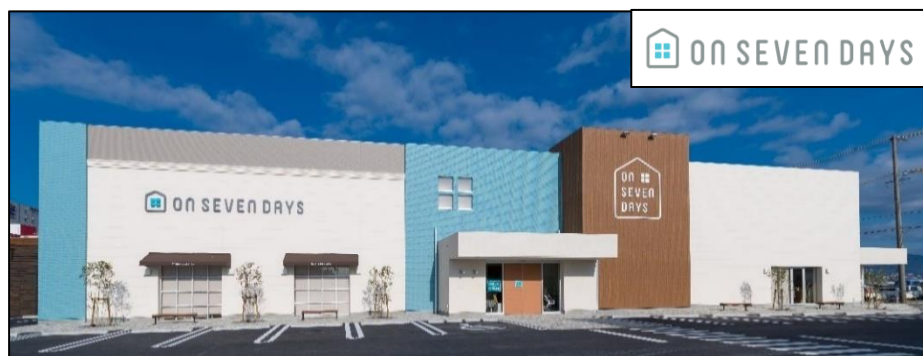
オンセブンデイズ店舗外観