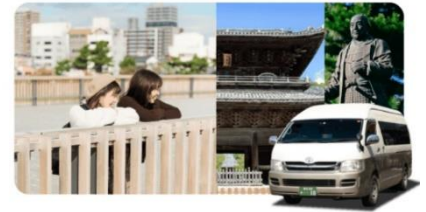
観光周遊モビリティイメージ