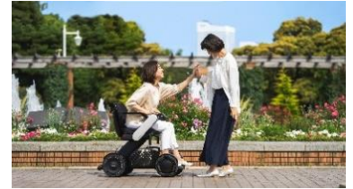
近距離モビリティイメージ