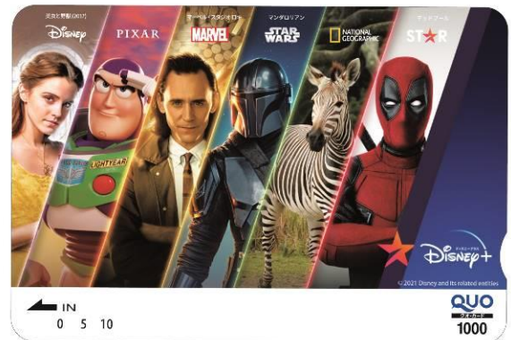
オリジナル QUO カード

※イメージ ※全て非売品です ©2021 Disney and its related entities