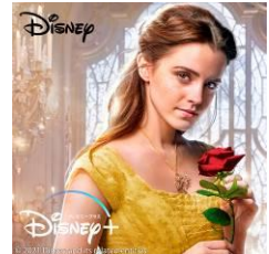
スタンプイメージ 「美女と野獣(2017)」