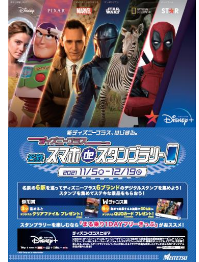
イベントポスター