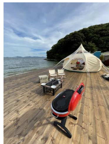
グランピングイメージ