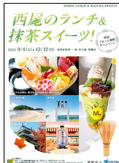
リーフレットイメージ