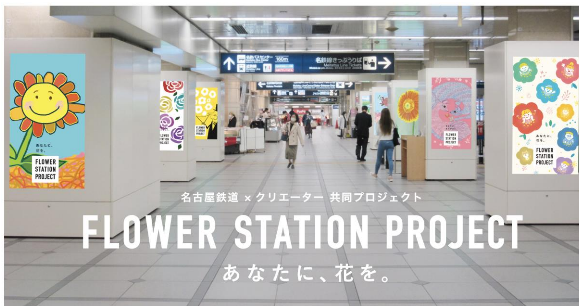
名鉄名古屋駅デジタルサイネージ