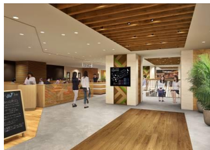
「ゾネキチ」内観(イメージ)