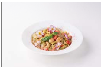
Diavolo e Bambina Due 「エビと桜色チーズの バジルクリームソース」