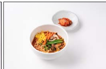
韓美膳 「ヌッケジャン麺」