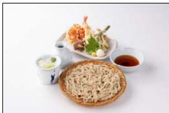
ソバキチ 「桜海老のかき揚げと春の 天盛り蕎麦」