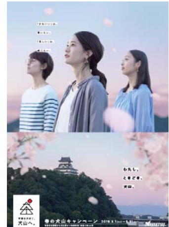
ポスターイメージ