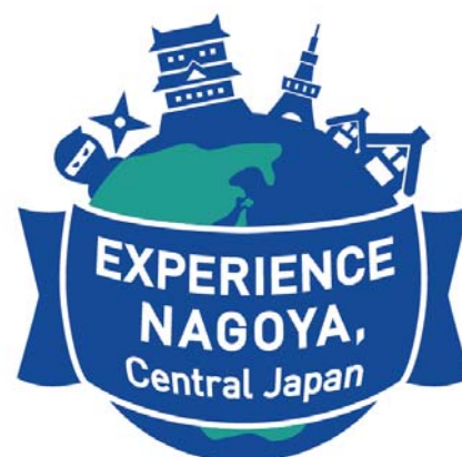
サイトロゴ イメージ