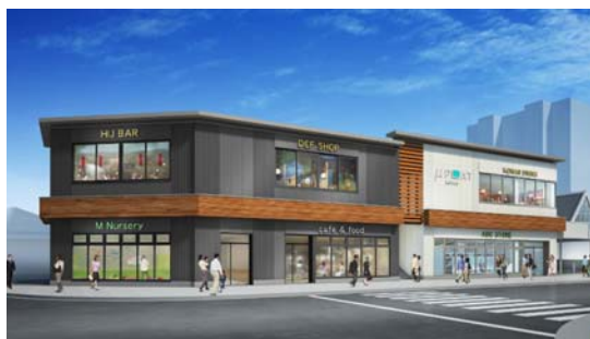
外観イメージ(昼景/北西より)