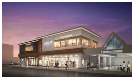
外観イメージ(夜景/南西より)