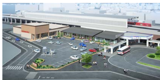
外観イメージ(全景)