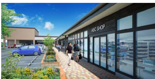
外観イメージ(近景)