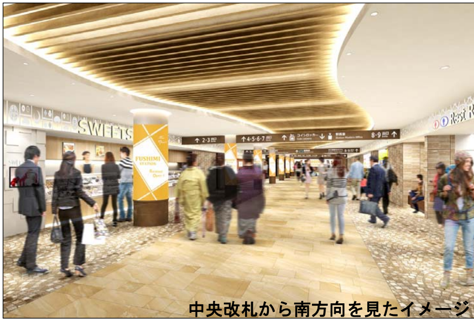
中央改札から南方向を見たイメージ