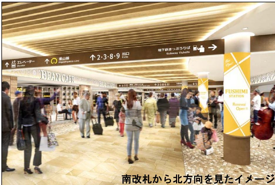
南改札から北方向を見たイメージ