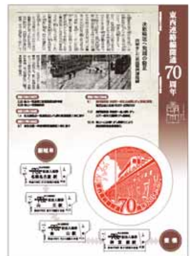
記念入場券イメージ