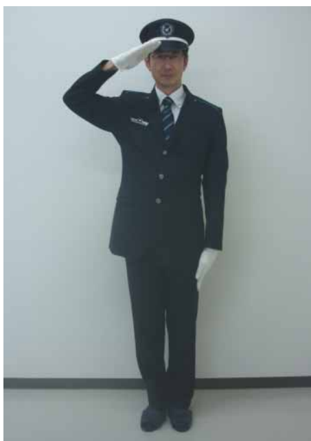
実際写真イメージ

本年6月に一新された名鉄の新制服を身にまとった、世界でひとつしかないお客さま自身の「名鉄なりきり3Dフィギュア」を東海地区で初めて、同イベント限定でプレゼントします。