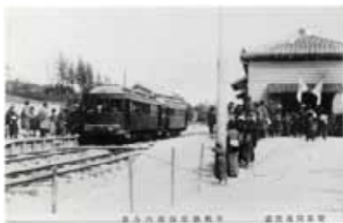
大正6年頃 有松裏(現有松)駅