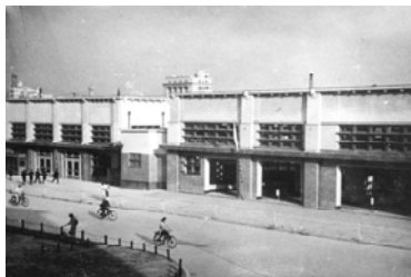
昭和16年頃 新名古屋(現名鉄名古屋)駅