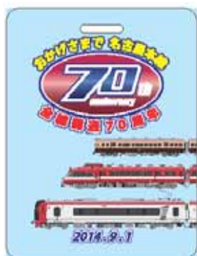
名古屋本線全線開通 70周年記念系統板イメージ

詳しくは当社ホームページ( http://top.meitetsu.co.jp/ )をご覧ください。