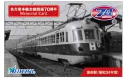
国府駅 配布カード