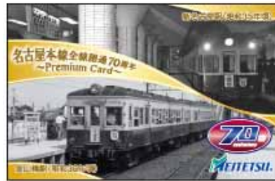
【プレミアムカード】 沿線クイズラリーご参加者限定