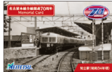
知立駅 配布カード