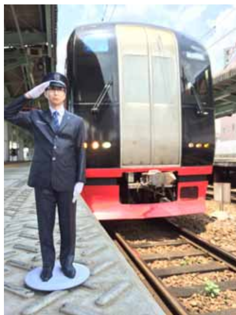
名鉄なりきり3Dフィギュア (高さ:約20cm)