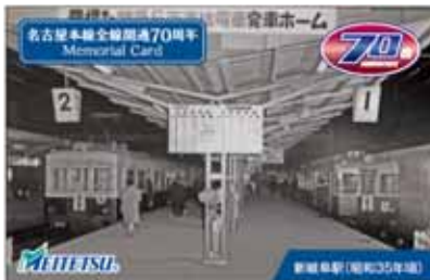
名鉄岐阜駅 配布カード