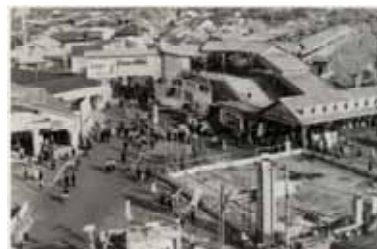
昭和35年頃 新岐阜(現名鉄岐阜)駅