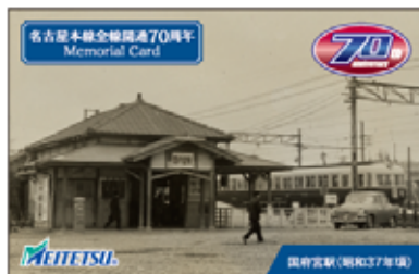
国府宮駅 配布カード