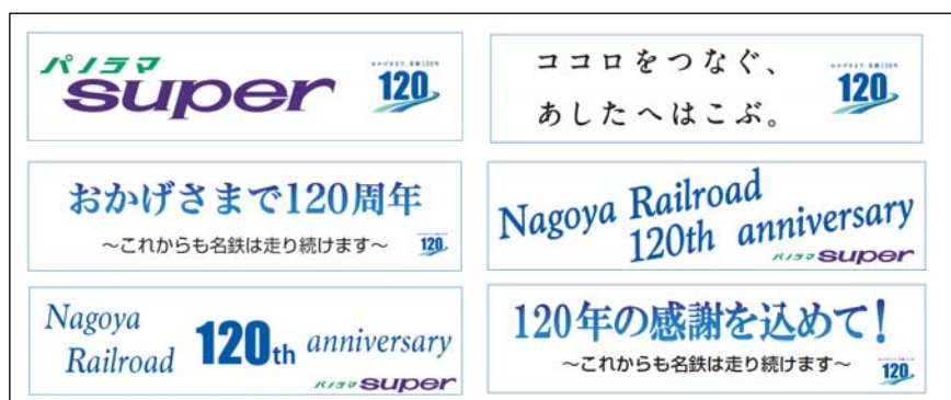
ヘッドマークイメージ(全 6 種類)

○内 容:特急車両の「1000-1200 系(パノラマ Super)」の 6 組成に期間を限定し、6 種類の名鉄創業 120 周年記念デザインがされたヘッドマークを掲出します。