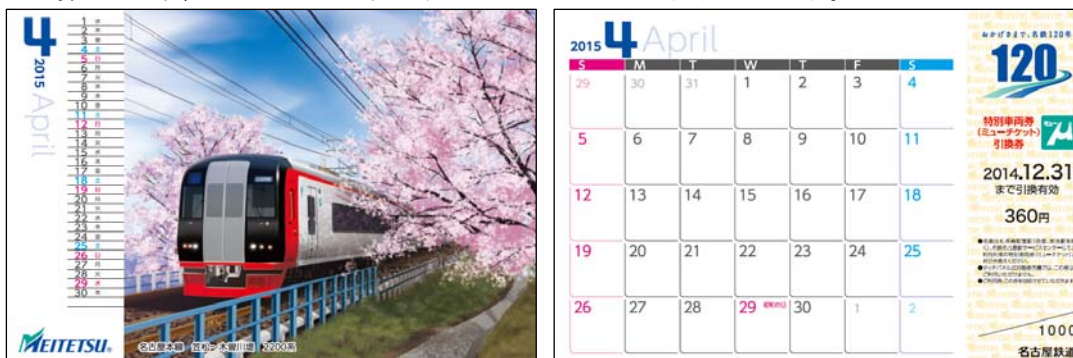
2015 名鉄カレンダー4 月イメージ(左:表、右:裏・ミューチケット付き)