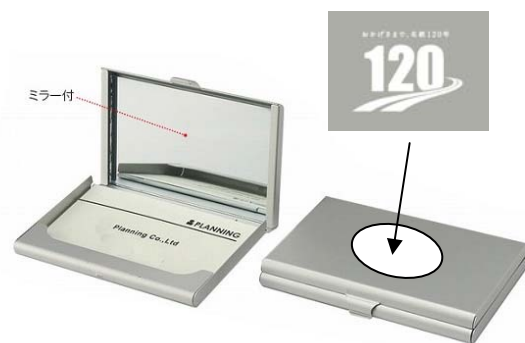
120周年ロゴ入りオリジナルカードケースイメージ