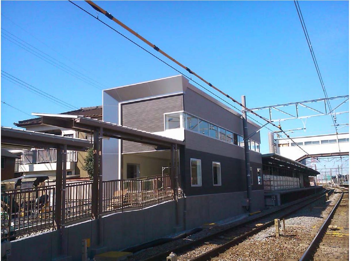
富士松駅南口駅舎(2014年2月中旬頃撮影)