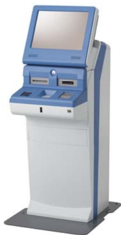
μ star station