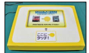
タッチ端末イメージ