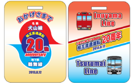
記念系統板(全2種類)