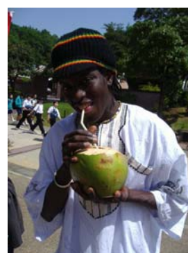
バリ／ココナッツジュース