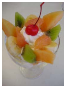
イギリス／トライフル