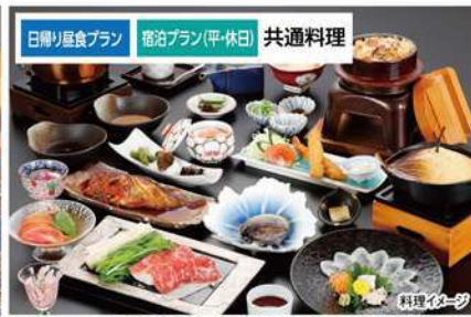
日帰り昼食プラン 宿泊プラン(平・休日) 共通料理