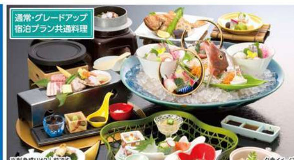
通常・グレードアップ 宿泊プラン共通料理