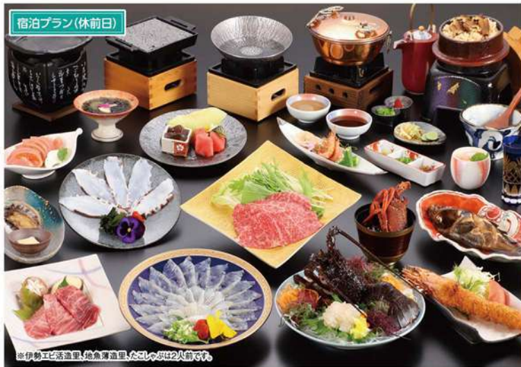
宿泊プラン(休前日)