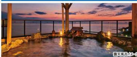
露天風呂イメージ