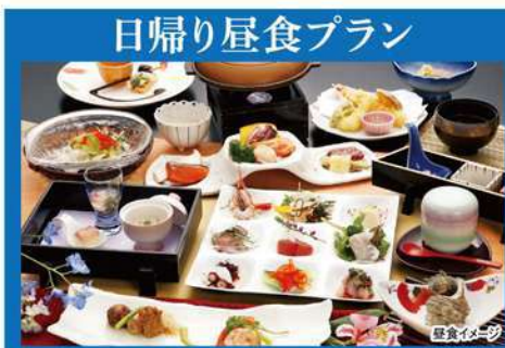
日帰り昼食プラン