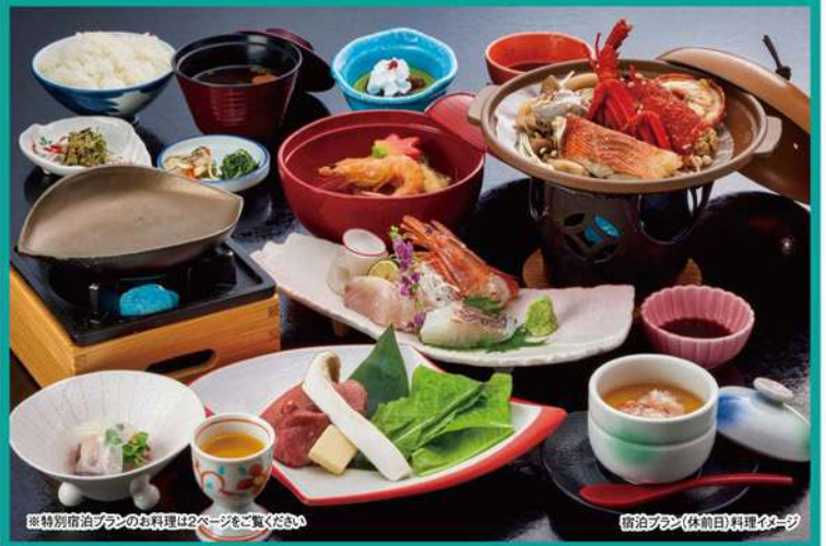
宿泊プラン(休前日)料理イメージ