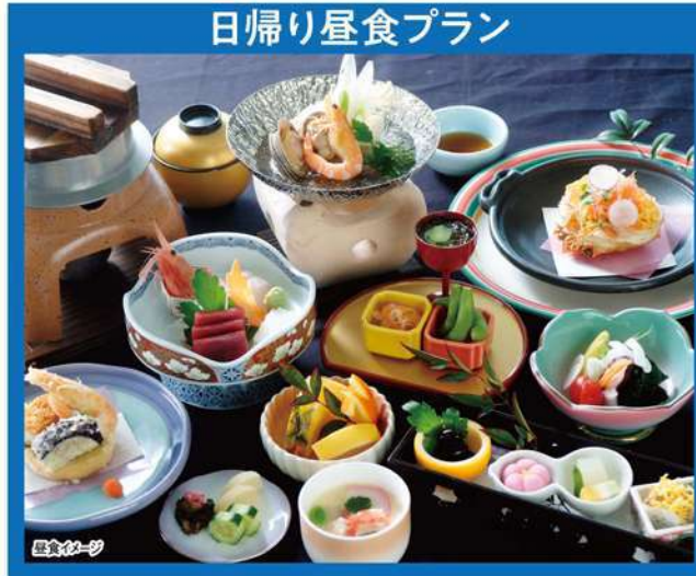
日帰り昼食プラン