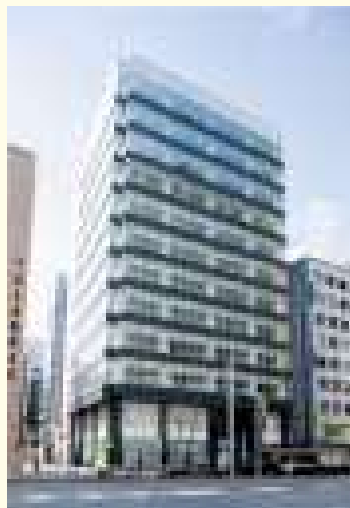
メイフィス名駅ビル