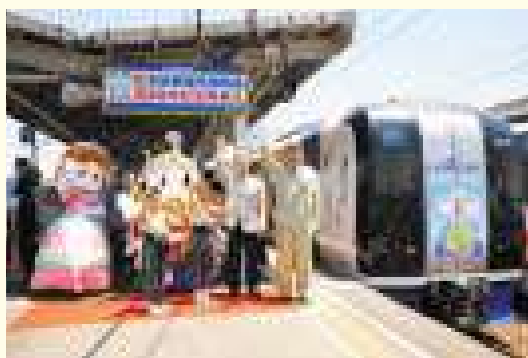
内海駅での発車式の様子

当社は、知多新線全線開通及び南知多ビーチランド開園から今年で30周年を迎えるのを記念して、6月5日に金山駅～内海駅間において、記念列車「ビーチランド30周年記念号」及び「知多新線全線開通30周年記念号」をイベント列車として運行しました。車内では海の生き物に関するクイズやビンゴ大会が開催され、家族連れのお客さまなどで賑わいました。