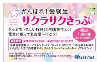
がんばれ！受験生 サクラサクきっぷ 台紙