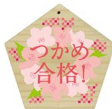
つり革に取り付けられる応援メッセージ