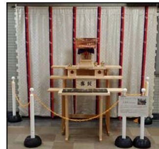
山田天満宮「別やしろ」