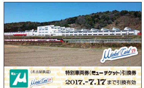
記念ミューチケットカードイメージ