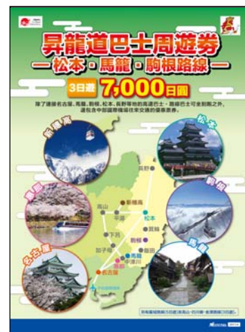
チラシイメージ 昇龍道フリーバスきっぷ ～松本・馬籠・駒ヶ根コース～