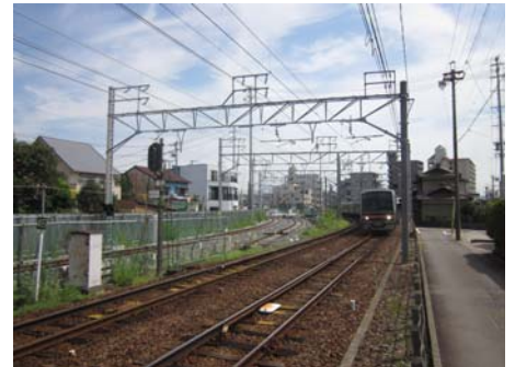
小幡～喜多山駅間(現在線・仮線)