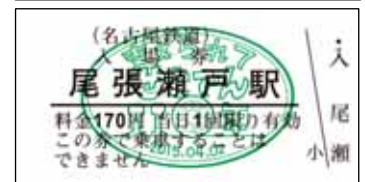
「記念スタンプ入場券」イメージ