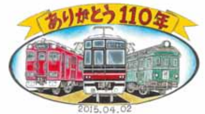
「記念イベント」ロゴイメージ