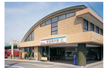
かんきょう環境モデル駅の尾張瀬戸駅