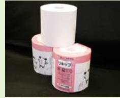
トイレトペーパー

使い終わったきっぷや定期けんは、回収してリサイクル(再利用)され、ベンチなどのいろいろな物に生まれ変わっているんだよ。