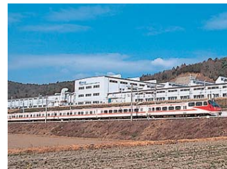
まいぎけんさじょう舞木検査場