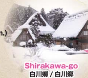
Shirakawa-go 白川郷 / 白川郷

To go to Shirakawa-go, you can transfer to the bus from Takayama Nohi Bus Center! 前往白川郷可轉搭高山濃飛巴士中心 白川郷へは高山濃飛バスセンターで乗り換えが可能!